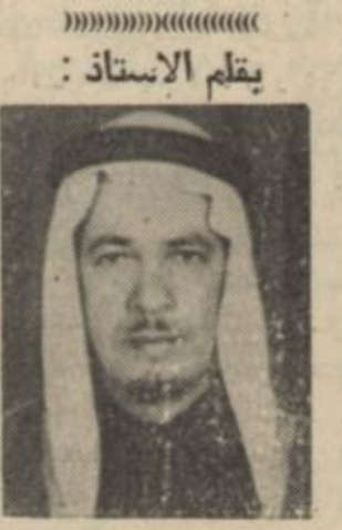
عشان الصالح وما تقول في اكرامك والحفاوة بك ورفاتك .. ان الملكة

بما انت اهل وما هو الواجب الذي يؤمن به كل فرد . يا صاحب السمو : ما احلى واغلى واغز وابقى ممن ان نحقق ايضا بابناك ابناء البحرين الشقيق دارسين في كليتنا العلمية والعسكرية والبروتولية .. تحية وتقديرا لك يا صاحب السمو .. واهلا وسهلا بك في المملكة العربية السعودية معقل العزة والكرامة وبلاد القبول ومنطق الاطال في كل مجال وحياتك الله يا ولي عهد البحرين الشقيق .