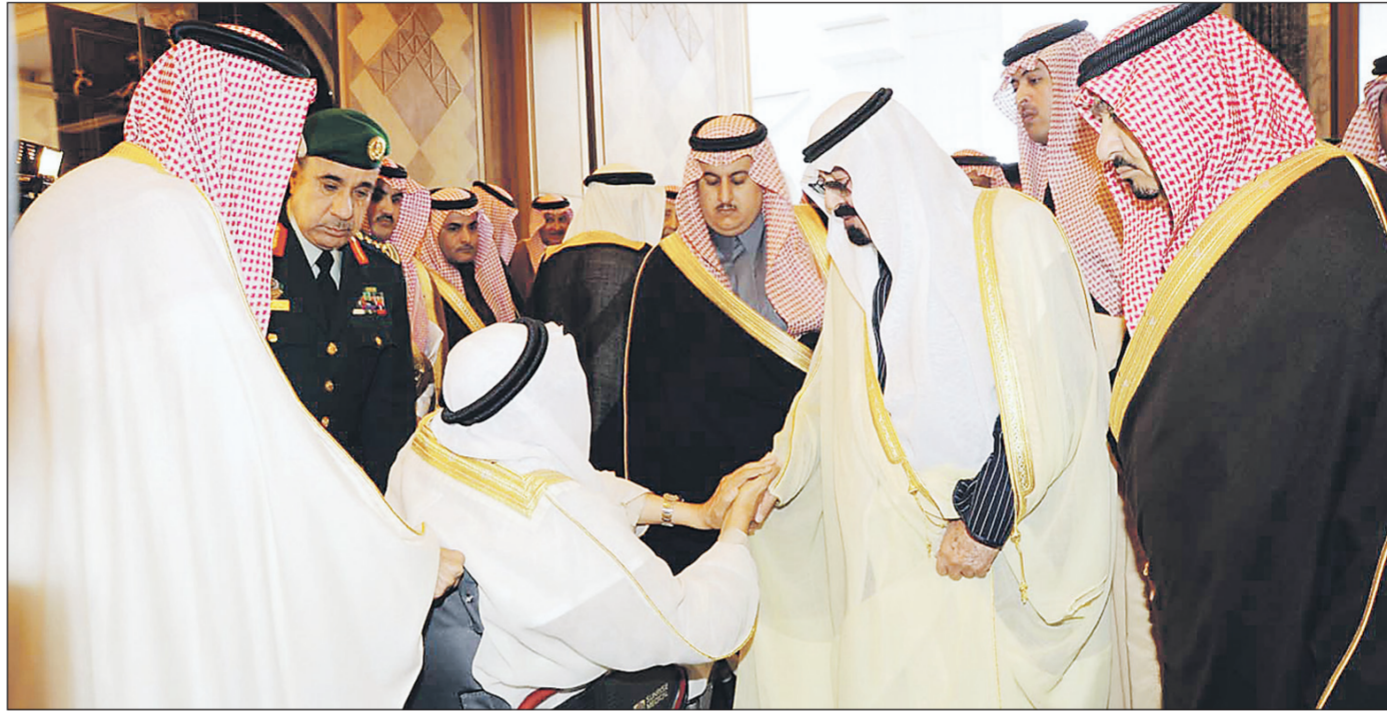
خادم الحرمين الشريفين مستقبلا المهنيين بسلامة الوصول في الرياض أمس.

كما حضر اللقاء، صاحب السمو الملكي الأمير عبدالله بن خالد بن عبدالعزيز، صاحب السمو الملكي الأمير عبدالإله بن عبدالعزيز مستشار خادم الحرمين الشريفين، صاحب السمو الأمير عبدالله بن مساعد بن عبدالرحمن، صاحب السمو الملكي الأمير مقرن بن عبدالعزيز رئيس الاستخبارات العامة، صاحب السمو الملكي الأمير عبدالعزيز بن عبدالله بن عبدالعزيز مستشار خادم الحرمين الشريفين، صاحب السمو الملكي الأمير منصور بن ناصر بن عبدالعزيز مستشار خادم الحرمين الشريفين، صاحب السمو الملكي سلمان بن محمد مستشار خادم الحرمين الشريفين.