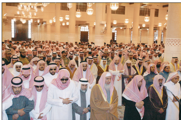
.. ويؤدي صلاة الميت على والده الأمير يوسف بن سعود.