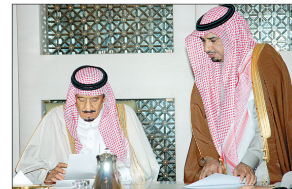
الأمير سلمان ترنسا اجتماع لجنة الاحتفال بعودة ولي العهد في الرياض أمس.