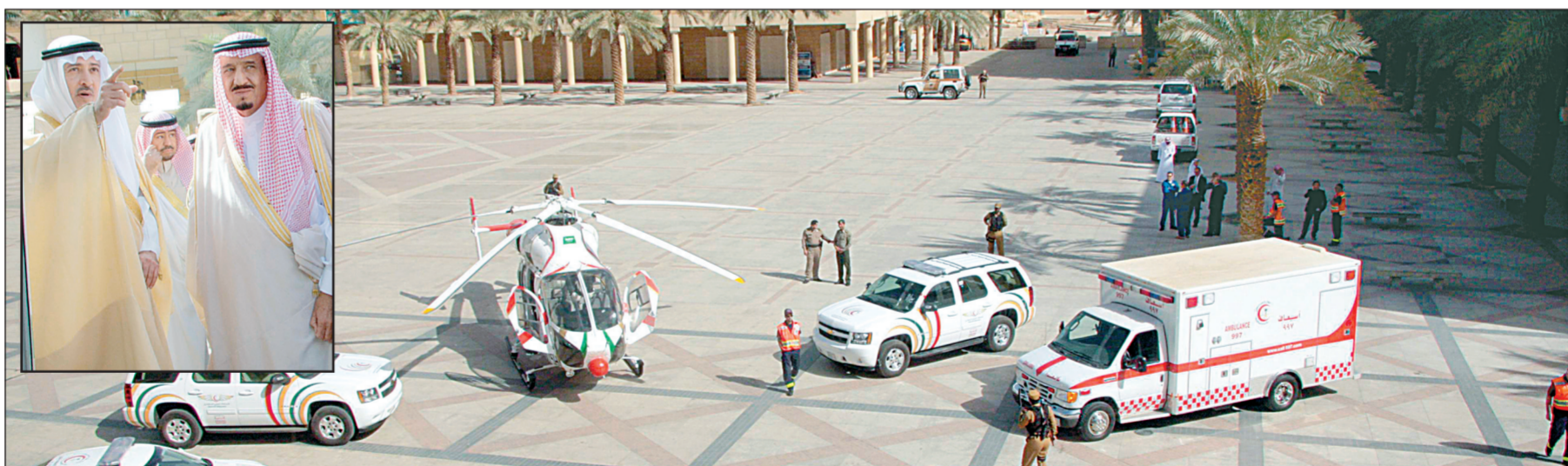
طائرة الإسعاف الجديدة لدى تشيبتها أمس، وفي الإطار أمير منطقة الرياض يستمع إلى شرح من الأمير فيصل بن عبد الله.

وتمنن الأمير سلمان بن عبدالعزيز للسفراء مشاعرهم الطيبة والصداقة، وتبادل معهم الإحاديث الودية. حضر اللقاء، صاحب السمو الملكي الأمير محمد بن سلمان بن عبد العزيز، ورئيس المراسم في وزارة الخارجية السفير علاء الدين العسكري.