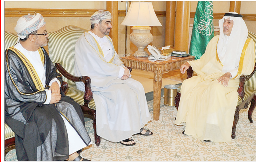
أمير منطقة مكة المكرمة مستقبلا أمس القنصل العماني.

البدء في العمل اعتمادا على الدراسات المحترفة المتوافرة، والإمكانات المتاحة». وأعطى أمير المنطقة مهلة زمنية حتى مطلع العام المقبل لإنجاز الدراسات اللازمة لتنفيذ المشروع، على أن يكون موسم الحج الحالي آخر فرصة لتقديم المقترحات ومراجعتها قبل بدء تنفيذها.