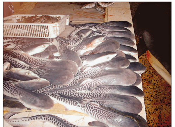
جانب من أسماك القرش التي تتواجد في بيئة البحر الأحمر.

كشفت دراسة علمية وجود بؤر ساخنة تتحرك خلالها أسماك القرش في البحر المفتوح جوار القنفذة والليث. وأبانت الدراسة التي أجراها مركز أبحاث البحر في جامعة الملك عبد الله للعلوم والتقنية، عبر تقنية لرصد حركة أسماك القرش باستخدام بطاقات تعريف صوتية، أن هناك بؤرا ساخنة من الشعب المرجانية تعج بأسماك القرش الضخمة بجوار القنفذة والليث. ويشار إلى أن تقنية الرصد تتمثل في غرز بطاقات التعريف خارج أجسام أسماك القرش وتحتوي أجهزة استقبال تنتشر بالقرب من ثول والليث رصد ومتابعة بيانات الحركة لهذه الأسماك. ويعتبر هذا البرنامج الأكبر من نوعه في العالم لرصد حركة أسماك القرش بالبطاقات، وأكدت الأبحاث أن النتائج الأولية لأسماك القرش التي تم رصدها في الدراسات السابقة توضح أن أسراب أسماك القرش في البحر الأحمر تتحرك بصورة محدودة مثرية للدهشة. ويشار إلى أن الدراسة الخاصة بأسماك القرش، ترصد العوائل من الكائنات المرتبطة بانماط حركة أسماك القرش، التعرف على شبكة الغذاء في الشعب المرجانية بالقرب من الليث، وأخذ عينات من مجموعة شجر المانغروف والأعشاب البحرية على امتداد الساحل مثل خور الخرار شمالي ثول.