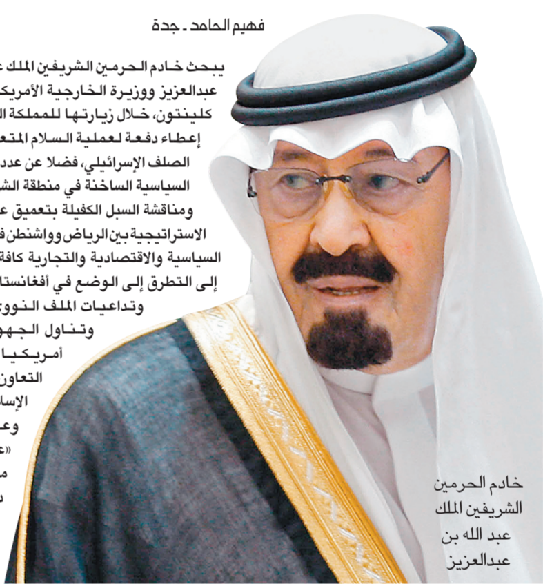
خادم الحرمين الشريفين الملك عبد الله بن عبدالعزيز

وعلمت «عكاظ» من مصادر دبلوماسية أميركية أن كلينتون ستلتق