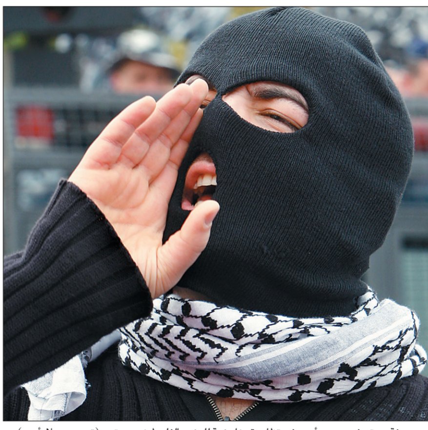
صرخة محتج في بيروت أمس في تظاهرة مناهضة للوضع الفلسطيني برمته.

وعرضت القناة العاشرة الإسرائيلية الأسبوع الماضي ما قالت إنه بعض الوثائق التي قدمها لها ضابط مخابرات فلسطيني تتضمن ملفات فساد مالي وأخلاقي لمسؤولين كبار في السلطة الفلسطينية. وظهر ضابط المخابرات فهمي شبانة على ذات القناة وهو يعطي عباس مهلة أسبوعين لاتخاذ إجراءات بحق الأشخاص المتهمين في الفساد المالي والأخلاقي، وإلا فإنه سيقدم للقناة المزيد من الوثائق.