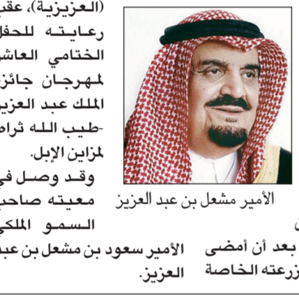
الأمير مشعل بن عبد العزيز

وصل صاحب السمو الملكي الأمير مشعل بن عبد العزيز رئيس هيئة البيعة الرياض قادماً من حفر الباطن عن طريق البر، بعد أن أمضى أياماً عدة في منزله الخاصة