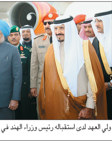
ولي العهد لدى استقباله رئيس وزراء الهند في الرياض أمس (واس)

الملك الهندي زينل الوزير المرافق، سفير خادم الحرمين الشريفين لدى الهند فيصل بن حسن طراد، وسفير الهند لدى المملكة تلميذ أحمد. وصاح دولة رئيس الوزراء الهندي مستقبلي صاحب السمو الملكي الأمير سعود الفيصل وزير الخارجية، صاحب السمو الملكي الأمير مقرن بن عبد العزيز رئيس الاستخبارات العامة، صاحب السمو الملكي الأمير سلطان بن عبد العزيز مساعد الأمين العام لمجلس الأمن الوطني للشؤون الاستخباراتية والأمنية، صاحب السمو الملكي الأمير محمد بن سلمان بن عبد العزيز المستشار الخاص لأمير منطقة الرياض، صاحب السمو الملكي الأمير بندر بن سلمان بن عبد العزيز.