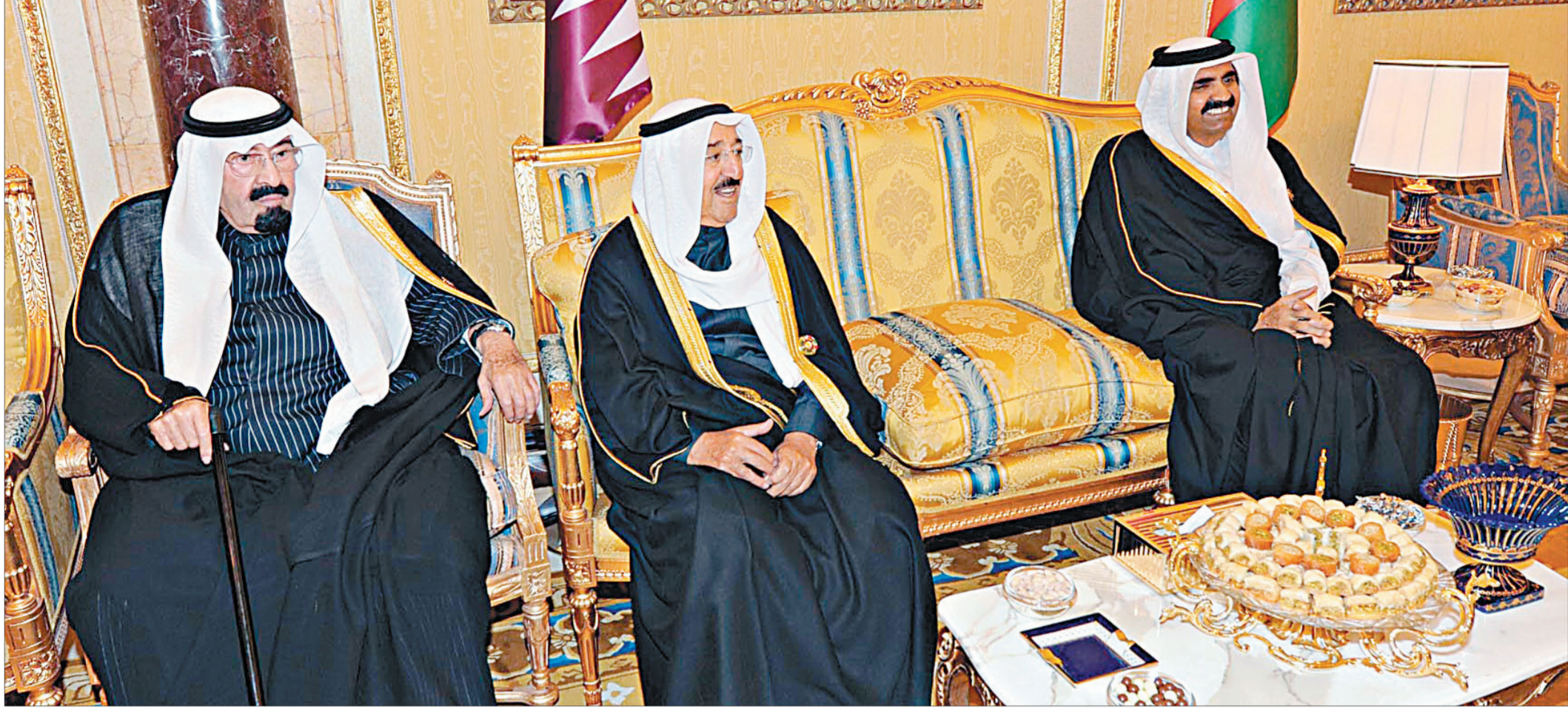
خادم الحرمين الشريفين والشيخ صباح الأحمد أمير الكويت و أمير قطر حمد بن خليفة آل ثاني في جلسة محادثات أثناء القمة الخليجية.

خادم الحرمين الشريفين سيكون له أثره على المنطقة والعالم في بناء روح التكاتف والتعاون وسيؤدي إلى معالجة الوضع المتدرج والعنف الذي تشهده المنطقة. وأضاف البركاني، الذي يعتبر أحد كبار مشايخ قبائل تـ، أن رسالة الملك واضحة لبناء روح التعاون والتكاتف وحرص الصفوف لمواجهة تحديات العقد الجديد الذي بدأ بفتح كبيرة ودسائس تستهدف السلم الاجتماعي العربي». وقال «الخادم الحرمين الشريفين مكانته في العالمين العربي والإسلامي وتشديده على مواجهة التحديات نابع من استشعاره بالفتن والمؤامرات التي تحاك ضد هذه الأمة وضرورة مجابهتها». وأوضح أن الخطاب سيكون له أثره ودوره في التصالح والتسامح والتكاتف لمجابهة هذه التحديات.