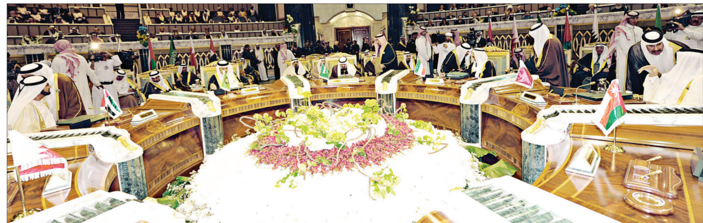
قادة مجلس التعاون الخليجي في الجلسة الختامية.

من الخارج أو من دول إقليمية رسمت مشاريعها التوسعية، بل هي تهدف أيضا إلى لم الصف العربي ودعوته إلى التماسك باحتضان خليجي هو وحده اليوم القادر على تنظيم المواقف وتعزيز الترخ تحت ضغوط شعوبها في ربيع لم يكتمل حتى اليوم، الخاضع لتدخلات خارجية قد تطيح بكل أهدافه وتسحق أزمهارة. ما أوجنا اليوم إلى التوحد بدل الاختلاف، خصوصا أن المنطقة أمام تحديات تشير إليها ممارسات قوى إقليمية ودولية، إن دلت على شيء فهي تدل على حجم الأطماع لدى تلك القوى لتغيير وجه المنطقة بأسرها. ما أوجح العراق الخارج من احتلاله والمزق داخليا، ومصر الضياع، وليبيا الفوضى، وسوريا