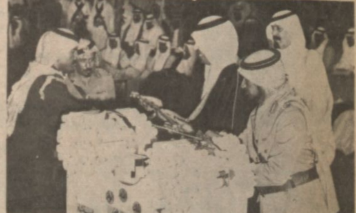
الشهادات والسيوف الذهبية امام سمو ولي العهد المعظم