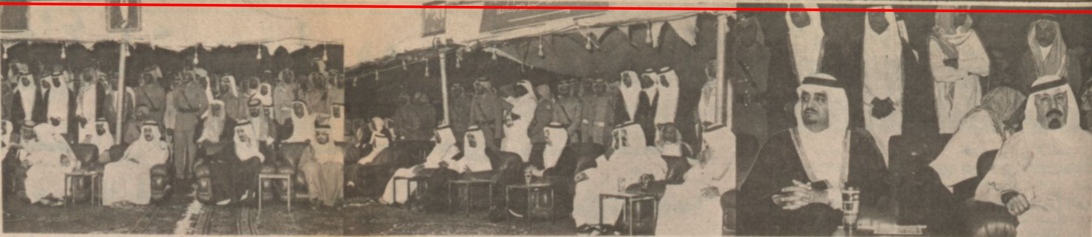
لغات من احتفال مدارس الحرس الوطني الذي شرفه سمو ولي العهد امس وسلم الشهادات للخريجين والجوائز للمتفوقين