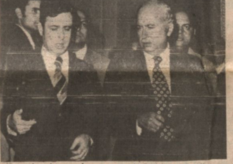
الامم المتحدة - ١٢-٧-١٧ واف استؤنفت اليوم مناقشات مجلس الامن حول الشكوى التي تقدمت بها اوغندا في اعقاب الفارة الاسرائيلية على مطار عنتيبي في حين واصلت الدول الافريقية انتقادها للفارة الاسرائيلية وطلبت بان تدفع اسرائيل تعويضاً لاوغندا عن هذه الفارة

مصر: تقترح ان تتحول قوات الامن العربية الى قوات رادعة سورية: تؤيد كل جهد عربي وهي مستعدة للاشتراك فيه المقاومة: تؤيد كل تدخل عربي يهدف لانهاء القتال وفك الحصار القاهرة - ١٢ يوليو الوكالات قرر مجلس وزراء الخارجية العرب في الجلسة الثالثة التي استنفذت اجتماعاتها في العاشرة من صباح اليوم الثلاثاء مواصلة مناقشة مشروع البيان الذي اتفقوا على اصداره ٠ وقد استغرقت الجلسة الثالثة ساعة واحدة ٠ وصرح مصدر عربي كبير بان وزراء الخارجية اتفقوا على نقتة وهي وقف اطلاق النار فوراً في لبنان اما باقي النقاط الأخرى سوف يواصلون مناقشتها ٠ وكان المؤتمر قد اوقف اعماله مساء امس ليتيح للجنة صياغة وضع مشروع القرار ٠ وقد استمرت الجلسة الثانية لوزراء الخارجية العرب حتى الساعات الاولى من صباح اليوم ( وما زالت الجلسة مستمرة ) بينما كانت الجلسة الاولى المطولة واجتماعات المؤتمر قد عقدت في الصباح ٠٠ اقترحت مصر فيها على الدول العربية اليوم ارسال قوات رادعة على فرض وقف اطلاق النار في لبنان وتقدم بهذا الاقتراح ظهر اليوم السيد اسماعيل فهمي خلال الكلمة التي القاها في الاجتماع وان تتحول قوات الامن العربية الى قوات رادعة على فرض وقف اطلاق النار ٠ وان تزود هذه القوات بكميات كافية من الاسلحة والمعدات ٠٠ والمدافع لكي يتسنى لها الاضطلاع بمهمتها ٠ وقال فهمي ان الموقف في لبنان يعد خطيراً للغاية وطلب الاطراف المتعادية بان تكون بالغة الصراحة لكي يتمكن مجلس الجامعة العربية