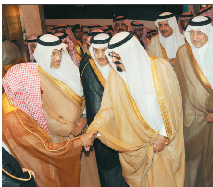
الملك لدى وصوله إلى العاصمة المقدسة ويبدو الأمير خالد الفيصل، وأمين العاصمة المقدسة م. أسامة البار.