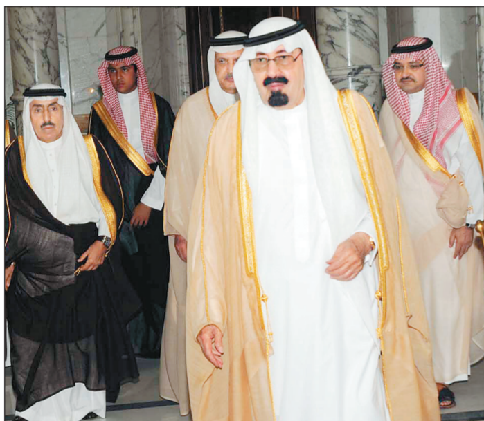
الملك لدى مغادرته جدة عصر أمس، وفي وداعه الأمير مشعل بن ماجد محافظ جدة.