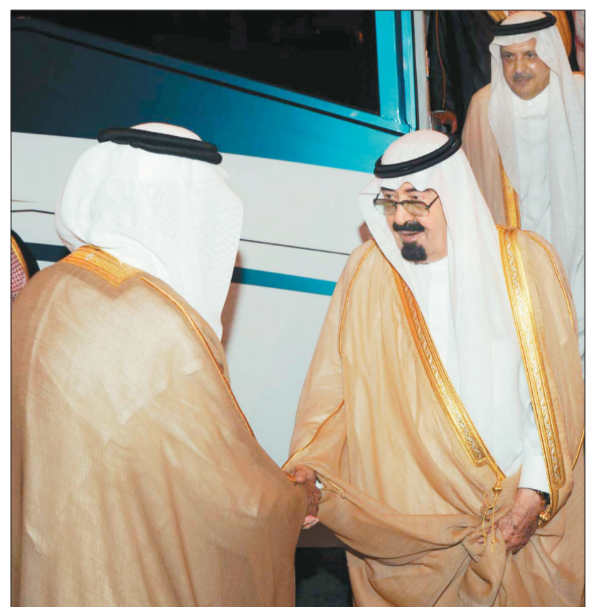
خادم الحرمين لدى وصوله إلى مكة المكرمة أمس، وفي معيته الأمير عبد الإله بن عبد العزيز.

ووصل برفقة خادم الحرمين الشريفين، صاحب السمو الملكي الأمير عبد الإله بن عبد العزيز مستشار خادم الحرمين الشريفين، صاحب السمو الأمير فيصل بن محمد بن سعود الكبير، صاحب السمو الملكي الأمير مقرن بن عبد العزيز رئيس الاستخبارات العامة، صاحب السمو الأمير فيصل بن عبد الله بن محمد وزير التربية والتعليم، صاحب السمو الأمير تركي بن عبد الله بن محمد مستشار خادم الحرمين الشريفين، صاحب السمو الملكي الأمير عبد العزيز بن ماجد بن عبد العزيز أمير منطقة المدينة المنورة، صاحب السمو الملكي الأمير عبد العزيز بن عبد الله بن عبد العزيز مستشار خادم الحرمين الشريفين، صاحب السمو الملكي الأمير منصور بن ناصر بن عبد العزيز مستشار خادم الحرمين الشريفين، صاحب السمو الأمير الدكتور بندر بن سلمان بن محمد مستشار خادم الحرمين الشريفين، صاحب السمو الملكي الأمير الدكتور عبد العزيز بن محمد وزير التعليم، صاحب السمو الأمير تركي بن عبد العزيز، صاحب السمو الملكي المقدم طيار ركن تركي بن عبد الله بن عبد العزيز، صاحب السمو الملكي الأمير سلطان بن عبد الله بن عبد العزيز، الشيخ مشعل العبد الله الرشيد، ورئيس المراسم الملكية محمد بن عبد الرحمن الطيبشي.. وكان خادم الحرمين الشريفين الملك عبد الله بن عبد العزيز غادر جدة في وقت سابق أمس، وكان في وداعه صاحب السمو الملكي الأمير مشعل بن ماجد بن عبد العزيز محافظ جدة، وعدد من المسؤولين.