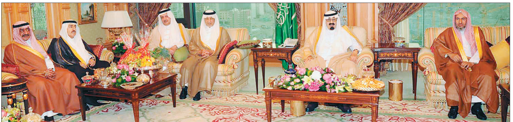
خادم الحرمين الشريفين في مكة المكرمة أمس، ويبدو الأمير خالد الفيصل، الأمير عبد الإله بن عبد العزيز، الأمير فيصل بن محمد بن سعود الكبير، الأمير مقرن بن عبد العزيز، و. محمد بن ناصر الخزييم نائب الرئيس العام لشؤون المسجد الحرام.