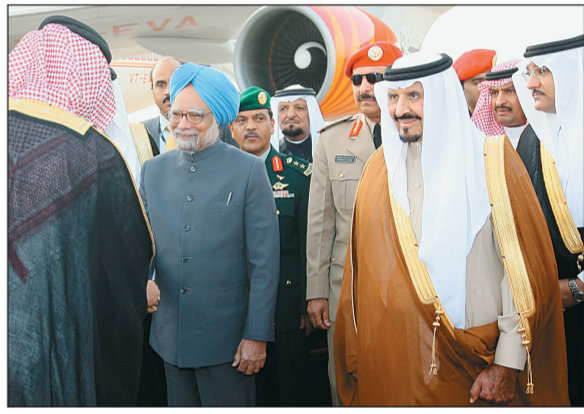
ولي العهد لدى استقباله رئيس وزراء الهند في الرياض أمس

واس - الرياض ترأس صاحب السمو الملكي الأمير سلطان بن عبد العزيز آل سعود ولي العهد نائب رئيس مجلس الوزراء وزير الدفاع والطيران والمفتش العام مستقبلي دولة رئيس وزراء الهند الدكتور مانموهان سينغ لدى وصوله الرياض أمس، كما كان في استقباله صاحب السمو الملكي الأمير نايف بن عبد العزيز النائب الثاني لرئيس مجلس الوزراء وزير الداخلية، صاحب السمو الملكي الأمير سلمان بن عبد العزيز أمير منطقة الرياض، صاحب السمو الملكي الأمير عبد العزيز بن محمد بن عياف آل مقرن أمين منطقة الرياض، وزير التجارة والصناعة عبد الله أحمد زينل الوزير المرافق، سفير خادم الحرمين الشريفين لدى الهند فيصل بن حسن طراد، وسفير الهند لدى المملكة تلميذ أحمد. صاحب دولة رئيس الوزراء الهندي مستقبلي صاحب السمو الملكي الأمير سعود الفيصل وزير الخارجية، صاحب السمو الملكي الأمير مقرن بن عبد العزيز رئيس الاستخبارات العامة، صاحب السمو الملكي الأمير محمد آل سعود وزير التربية والتعليم، صاحب السمو الملكي الأمير الدكتور منصور بن متعب بن عبد العزيز وزير الشؤون البلدية والقروية، صاحب السمو الملكي الأمير بن عبد الله بن عبد العزيز نائب رئيس الحرس الوطني للشؤون التنفيذية، صاحب السمو