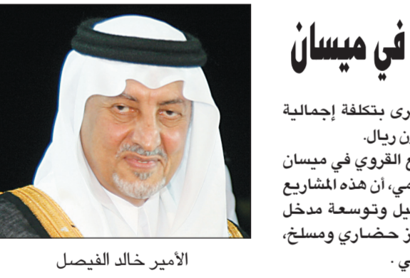
الأمير خالد الفيصل

واس - الرياض بعث خادم الحرمين الشريفين الملك عبد الله بن عبد العزيز آل سعود، وصاحب السمو الملكي الأمير سلطان بن عبد العزيز، برقية تعزية ومواساة لرئيس باكستان ورئيس الوزراء وزير الدولة عضو مجلس الوزراء رئيس ديوان رئاسة مجلس الوزراء وزير الدولة عضو مجلس الوزراء الدكتور عبد العزيز بن عبد الله الخويطر وزير العمل وسفير خادم الحرمين الشريفين لدى الولايات المتحدة الأمريكية عادل الجبير وقائد الحرس الملكي الفريق أول حمد العوهلي وسفير خادم الحرمين الشريفين لدى دولة قطر أحمد القحطاني. وقال الملك عبد الله في برقيته «علمت ببلاغ الأسى نبأ الحادث الإرهابي الذي وقع في أحد المساجد شمال غرب باكستان، وإنني إذ أعرب لفخامتكم عن شجبنا واستنكارنا الشديد لهذا العمل الإجرامي، لأقدم أحر التعازي والمواساة لفخامتكم ولأسر الضحايا ولشعب باكستان الشقيق، داعيا المولى سبحانه وتعالى أن يتغمّد المتوفين بواسع رحمته ورضوانه، ويسكنهم فسيح جناته، وأن يمن على المصابين بالشفاء العاجل، وأن يحفظكم وشعب باكستان الشقيق من كل سوء إنه سميع مجيب». كما بعث خادم الحرمين الشريفين وسمو ولي العهد برقية تعزية ومواساة للرئيس الإندونيسي الدكتور الحاج سوسيلو بامبانغ يودويونو إثر انهيار السد المائي الواقع بمشارف جاكرتا، وما نتج عنه من وفيات وإصابات وأضرار.