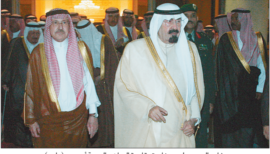
خادم الحرمين لدى مغادرته قاعدة الرياض الجوية أمس.