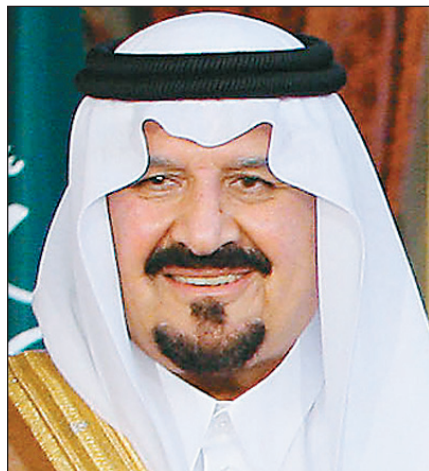
الأمير سلطان بن عبدالعزيز

وأوباما ونائبه على ما أبدياه من مشاعر نبيلة وصادقة وتمنياتها لهم بالشفاء العاجل. وقال: (بداية أود أن أعبر عن شكري للرئيس ولكم شخصياً على ما عبرتم عنه من مشاعر نبيلة وصادقة، راجياً أن تتلقوا خالص تحياتنا للرئيس وشكرنا على ما نلقاه من حفاوة في بلدكم والصدق). وأكد الأمير سلطان اعترازه