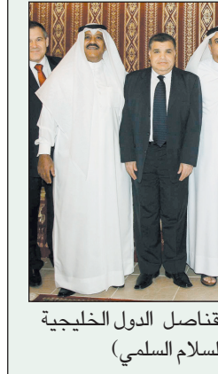
الشماسي يتسلم درع «عكاظ» بحضور قناصل الدول الخليجية والعربية.

درع «عكاظ» للمحتفى به. القنصل الكويتي قال لـ «عكاظ»: هذا التكريم للاح السفير الشامي يأتي تقديراً لما عرفناه عنه من دماثة الخلق وحبه للجميع وتعاونيه وصداقه. وثمن مشاركة «عكاظ» مؤكداً تميزها في كافة المجالات، ووصفها بأنها صحيفة الأولى في المملكة. من جانبه، عبر القنصل الإماراتي عن شكره لخادم الحرمين الشريفين وولي العهد وحكومة المملكة والشعب السعودي على ماقيه من تعاون خلال فترة عمله، متمنياً هذا التكريم من أخيه القنصل الكويتي. وأثنى على الدور الذي تضطلع به «عكاظ» في خدمة العمل الإعلامي الخليجي.