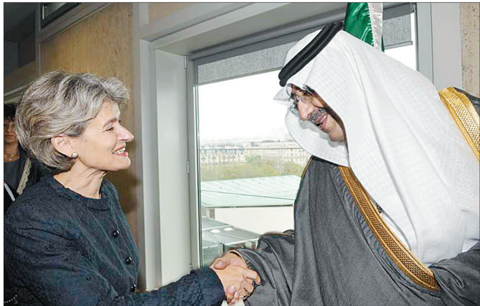
الأمير فيصل بن عبد الله مصافحا مدير عام اليونسكو في باريس أسس الأول.

إطار سعي المشروع لإيجاد نقلة نوعية في التعليم العام من أجل ضمان جودة العملية التعليمية بجمع عناصرها وصولا إلى الاستثمار الحقيقي في الإنسان. وفي سياق مختلف، يشهد الأمير فيصل بن عبد الله غدا ورشة عمل بعنوان: «إصلاح التعليم في الدول العربية. المملكة العربية السعودية نموذجا»، بتنظيم من كلية التربية في جامعة الملك سعود بالتعاون مع بعض المؤسسات والجامعات العالمية لمناقشة قضايا التربية في العالم العربي والمحلة على وجه الخصوص.