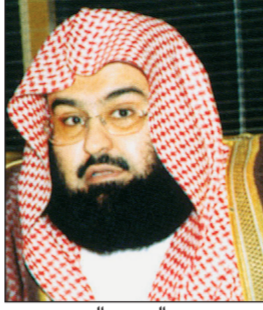
د. عبد الرحمن السديس

البلاد وليسعد العباد فعضاء متدفق وحلم متحقق في هذا المنجز التاريخي العظيم». وإزاء ذلك، نبه الشيخ السديس إلى أن «واجب الجميع من القادة والعلماء وحملة الأقالام ورجال الصحافة والإعلام وشباب الأمة والغيورين وعلى مصالحها أن يباركوا بإجماع واتفاق هذه الجهود الخيرة في ظل مقاصدنا الإسلامية وضوابطنا الشرعية وفيما يحقق الحفاظ على ثوابت الأمة وقيمها». وحذر الخطيب السديس من على منبر المسجد الحرام الجميع «من الخوض في ما لم يتبين لهم أمره