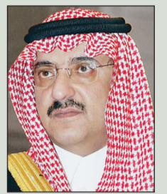
الأمير محمد بن نايف

ووصف الشيخ السديس هذه الجامعة بالريادة وسمو الأهداف ونبيل المقاصد في غاياتها شاملة في ذلك لك أقسامها وتخصصاتها، سائلا الله «أن يري رائدها