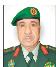
الفريق أول حمد العوهلي

نحن عبدالله بن عبدالعزيز آل سعود ملك المملكة العربية السعودية والقائد الأعلى لكافة القوات العسكرية، بعد الاطلاع على المادة ٢٧ من نظام خدمة الضباط، الصادر بالمرسوم الملكي رقم م/٤٢ وتاريخ ١٣٩٣/٨/٢٨هـ المعدلة بالمرسوم الملكي رقم م/٥٤ وتاريخ ١٤٢٩/٨/٢٦هـ، وجاء في نص الأمر الملكي: «وبعد الاطلاع على الأمر الملكي رقم ١٨١/١ وتاريخ ١٤٢٧/١٢/٢٤هـ، وبناء على ما عرضه علينا قائد الحرس الملكي، امرنا بما هو آت: أولاً يعين الفريق عبيد بن غيث العنزي نائباً للقائد الحرس الملكي، ثانياً: يرقى اللواء عبدالله بن علي القحطاني إلى رتبة فريق ويعين مساعداً للقائد الحرس الملكي، ثالثاً يبلغ امرنا هذا للجهات المختصة لاعتماده وتنفيذه».