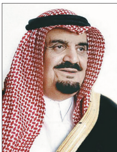
الأمير مشعل بن عبدالعزيز

العظمى على مختلف الأصعدة السياسية، العلمية، والاقتصادية، والاجتماعية، وإن ما حققته المملكة في عهد خادم الحرمين الشريفين من تطور جعلها مقصداً لجميع دول العالم في المجالات كافة. وبين رئيس هيئة البيعة أن جهود خادم الحرمين الشريفين لم تقتصر على رعاية وصيانة بلاده والاهتمام بأبناء شعبه فحسب، بل تجاوز ذلك ليتمد إلى جميع دول العالم فجعل من المملكة العربية السعودية محوراً لتوازن للدول العربية وأماناً للدول الإسلامية وضماناً للدول العالمية عبر مبادراته التي أطلقها وتكفل بها لحل النزاعات العربية وتقديم الإغاثة ومد يد العون للدول الإسلامية ومبادرة حوار أتباع الأديان ومكافحة الإرهاب على الصعيد الدولي.