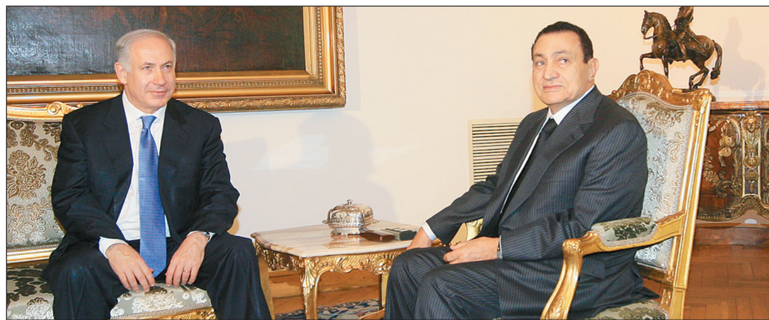
الرئيس المصري حسني مبارك يبحث مع بنيامين نتنياهو ملفات السلام في القاهرة أمس.

نهاية نوفمبر (تشرين الثاني) تعليقا موقفاً للاستيطان في الضفة الغربية يستنتج القدس الشرقية، ورفض الفلسطينيين استئناف المفاوضات على أساس العرض الإسرائيلي، معتبرين أنه غير كاف بتاتا، مشددين على ضرورة وقف الاستيطان في القدس الشرقية، التي يريدون أن تكون عاصمة لدولتهم في المستقبل.