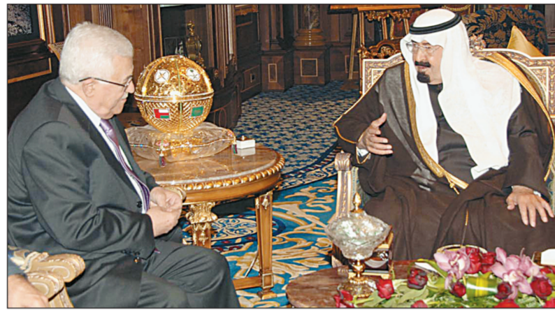
خادم الحرمين الشريفين يتداول مع الرئيس الفلسطيني ما يكتنف عملية السلام من عثرات في الرياض أمس. (واس)

وسبل تعزيزها في مختلف الإقليمية والدولية ذات الاهتمام المشترك. المجالات، بالإضافة للقضايا المشتركة.