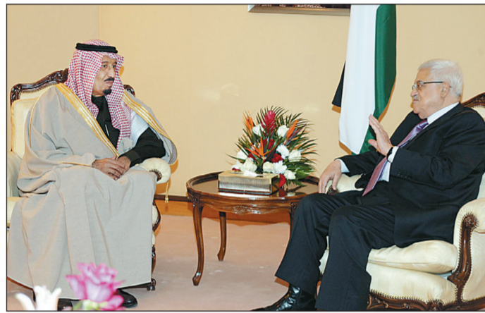
الأمير سلمان بن عبدالعزيز يكرم وفادة الرئيس الفلسطيني في الرياض البارحة.