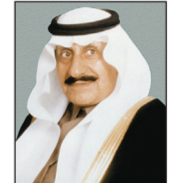
م. عبدالatif بن عبدالعزيز الرشيد

رفع صاحب السمو الأمير عبد الله بن عبد العزيز بن مساعد أمير منطقة الحدود الشمالية باسمه وأهالي المنطقة الشنتاني والتبريكات لخادم الحرمين الشريفين الملك عبد الله بن عبد العزيز بمناسبة مغادرته المستشفى، بعد أن من الله عليه بالصحة والعافية، وقال: نحمد الله أن أسبغ على والدنا لباس الصحة والعافية ونسال الله أن نراه في القريب العاجل عائدا إلى أرض الوطن، وأضاف: «خادم الحرمين الشريفين كان صاحب الأيادي البيضاء والآراء النيرة في عملية التطوير».