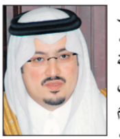
م. عبدالله بن خالد بن عبدالعزيز آل سعود

أكد صاحب السمو الأمير عبد الله بن خالد بن عبد الله بن مساعد رئيس الهيئة العليا لتطوير منطقة حائل أن سلامة وشفاء خادم الحرمين الشريفين الملك عبد الله بن عبد العزيز وخروجه من المستشفى جعل الوطن وأبناؤه يعيشون أجمل فرحة ويعبرون عن أكر تحفاه حبا ووفاء بتلقائية دلت على أن الوطن يعيش ولله الحمد في عهد خير ونماء وحب صادق وتبادل بين القيادة والشعب.