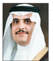
م. محمد بن فهد بن عبدالعزيز آل سعود

عبر صاحب السمو الملكي الأمير محمد بن ناصر بن عبدالعزيز أمير منطقة جازان، عن فرحته الكبيرة وسعادته الغامرة وأهالي المنطقة بمناسبة مغادرة خادم الحرمين الشريفين الملك عبد الله بن عبدالعزيز آل سعود إلى أرض الوطن، وقال: «استبشر الجميع في منطقة جازان كما هو الحال والمشاعر الصادقة في كل أرجاء الوطن، القيادة الرشيدة لهذا الوطن مع أبناؤها من المواطنين، مشيراً إلى أنه لا يخفى على الجميع المكانة العظيمة التي يحظى بها خادم الحرمين الشريفين عند جميع أبناؤه من أفراد الشعب السعودي الكريم الذين كانوا يلهجون بالدعاء أن يلبسه تمام الصحة والعافية، وقال أمير الشرقية «الفرحة الكبيرة التي عمت كل أرجاء الوطن منذ سماع نيا مغادرته حفظه الله المستشفى، واستمرار للتلاحم والتعاضد الكبير الذي يجمع