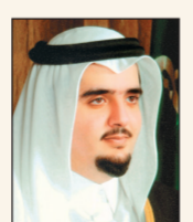
م. عبدالعزيز بن فهد بن عبدالعزيز آل سعود

ابتهل صاحب السمو الملكي الأمير عبد العزيز بن فهد بن عبد العزيز وزير الدولة عضو مجلس الوزراء رئيس ديوان رئاسة مجلس الوزراء، إلى الله بأن يتم شفاء قائد مسيرتنا ويطلع في عمره، ويعيده إلى وطنه ومواطنيه سالماً معافياً بإذن الله، ليواصل مسيرته العظيمة في نهضة بلاده ونصرة قضايا الامتثال للإسلامية والعربية. وعبر الأمير عبد العزيز بن فهد عن فرحته الكبيرة وسعادته الغامرة بمناسبة مغادرة خادم الحرمين الشريفين للمستشفى، كما رفع خالص التهنية إلى نائب خادم الحرمين الشريفين صاحب السمو الملكي الأمير سلطان بن عبد العزيز آل سعود، وإلى صاحب السمو الملكي الأمير نايف بن عبدالعزيز آل سعود النائب الثاني لرئيس مجلس الوزراء وزير الداخلية وإلى شعب المملكة بهذه المناسبة.