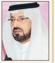
م. سعود بن عبد المحسن بن عبدالعزيز آل سعود

رفع صاحب السمو الملكي الأمير سعود بن عبد المحسن أمير منطقة حائل، باسمه وباسم أهالي المنطقة أسمى آيات التهاني والتبريكات للقيادة الحكيمة وللشعب السعودي الوفي بسلامة وأبناؤها، لا سيما أن الله خصها بالحرمين الشريفين، وقيادة حكيمة وشعب وفي وقريب من قيادته يبدلها حبا وبحب ووفاء بوفاء».