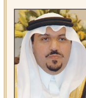
م. فهد بن مقرن بن عبدالعزيز آل سعود

هنأ صاحب السمو الملكي الأمير الدكتور فيصل بن مشعل بن سعود بن عبد العزيز نائب أمير منطقة القصيم جميع بخروج خادم الحرمين الشريفين من المستشفى، قائلا: «استبشر المواطنين بخبر إعلان الديوان الملكي، شفاء خادم الحرمين الشريفين وخروجه بسلامة والعافية من المستشفى، ونسال الله أن يعيده سليماً معافياً لوطنه وشعبه الوفي ليكمل مسيرة الخير والنعماء التي تعيشتها بلادنا بقيادتها الحكيمة».