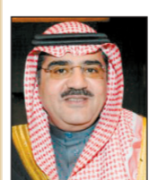
م. فهد بن مقرن بن عبدالعزيز آل سعود

عبر صاحب السمو الملكي الأمير فهد بن مقرن بن عبد العزيز عن عظيم سعاداته بخروج خادم الحرمين الشريفين من المستشفى قائلا: «تعجز الكلمات عن وصف فرحة الوطن بسلامة الوالد والقائد ورؤيتنا له يسير على قدميه سالماً معافياً، ويخفى أن نرى الفرحة في عين طفل يحمل صورته احتفاء بسلامته حفظه الله، فبصماته شعر بها الطفل قبل الكبير، وحب المواطنين أكبر دليل على عدله مع شعبه وسعيه أن يكون حاكماً عادلاً ينصف المظلوم».