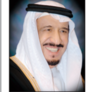
م. سلمان بن عبدالعزيز آل سعود

لنا قائداً فذا نذر نفسه لخدمة أمته، ومن عظيم حقه علينا أن نك نل كل الحب والمودة وندعو له بطول العمر وتتمام العافية». وختم الأمير سلمان تصريحه بسؤال الله جلت قدرته إلا طول غيبة خادم الحرمين الشريفين، وأن يعود إلى بلاده ليكمل مسيرته التي نذرنا لخدمة وطنه وشعبه والامتثال للإسلامية والعربية. وقال أمير الرياض «إن من نعم الله علينا أن هيا