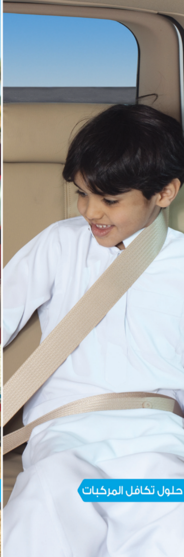
حلول تكافل المركبات