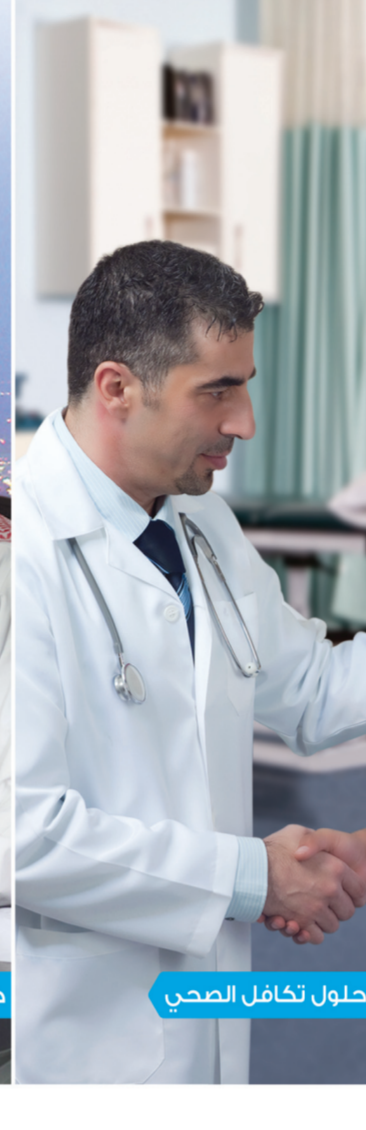
حلول تكافل الصحي