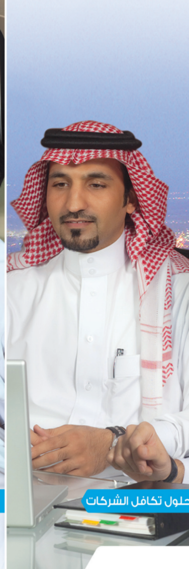
حلول تكافل الشركات