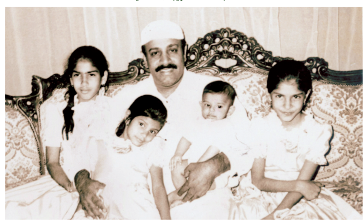
.. وسط أبنائه وأحفاده.