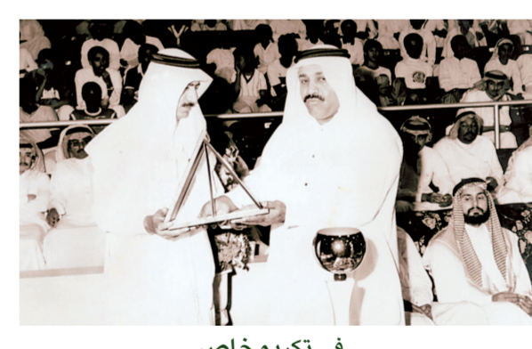
.. في تكريم خاص.