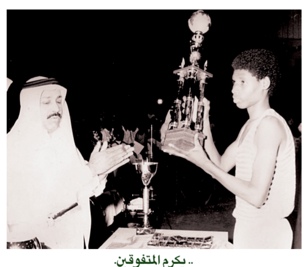
.. يكرم المتفوقين.