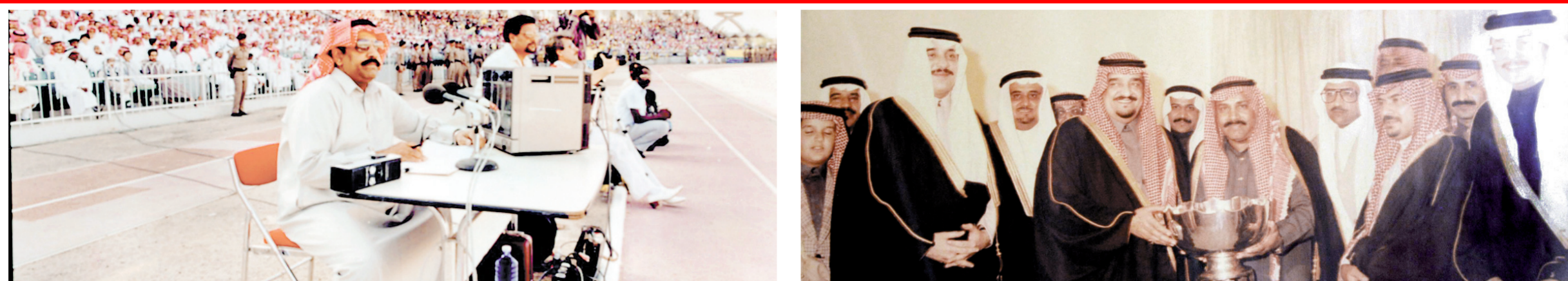
الملك فهد (يرحمه الله) وإلى جواره رمضان في احتفالية كأس آسيا. محمد رمضان يعلق على إحدى مباريات الدوري من الملعب.