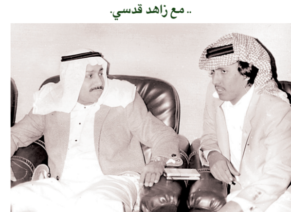
رمضان في مناسبة وحدوية.