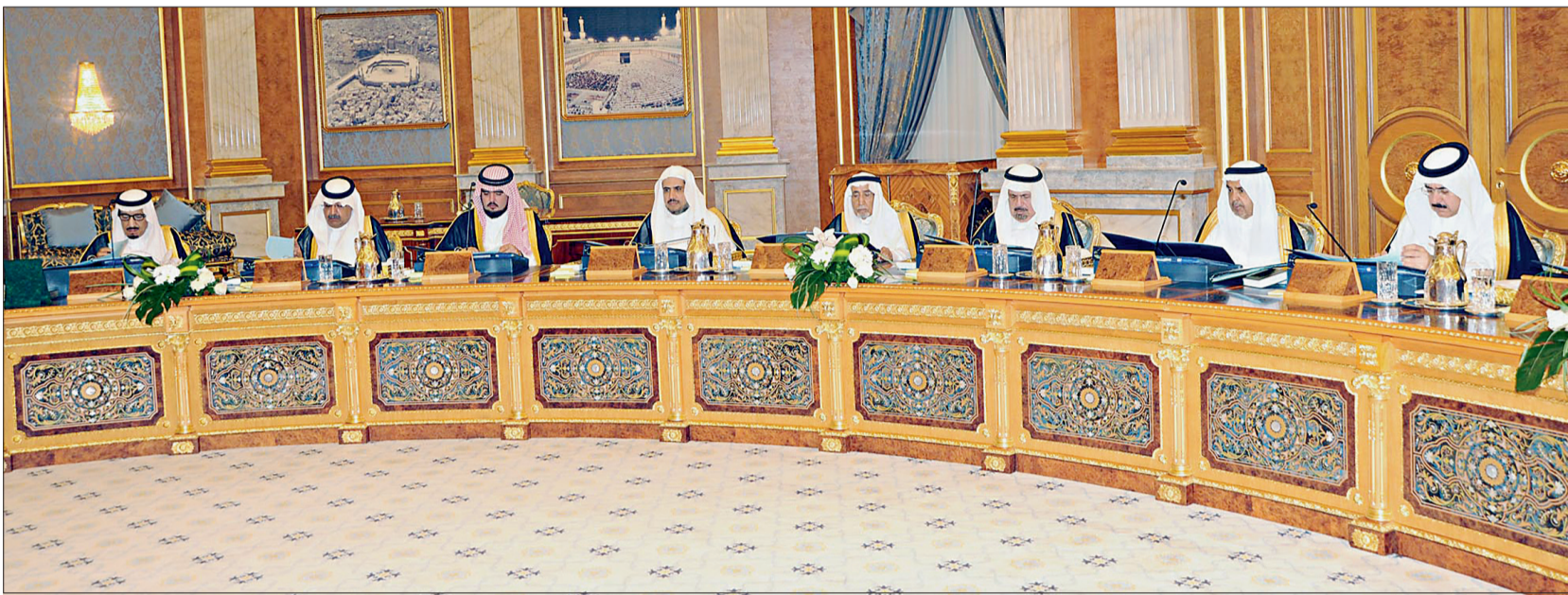
سمو ولي العهد والأمير فيصل بن عبدالله والأمير عبدالعزيز بن فهد وعدد من الوزراء خلال الجلسة.