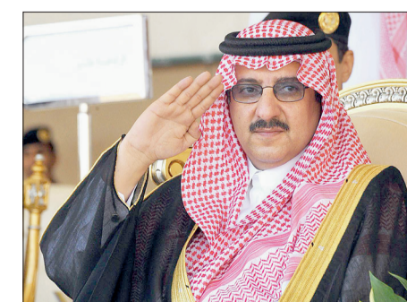
الأمير محمد بن نايف

يشهد صاحب السمو الملكي الأمير محمد بن نايف بن عبدالعزيز مساعد وزير الداخلية للشؤون الأمنية اليوم، فرضية صولة الحق رقم ٥، التي تنفذها قوة الطوارئ الخاصة بمحافظة جدة، وذلك على طريق الساحل بعد نقطة تقفيس السنابل. وأوضح مسؤول العلاقات العامة سعيد الهاشمي، أن الفرضية تقام سنوياً، وتشارك فيها قوات الطوارئ بمنطقة مكة المكرمة، وهي عبارة عن مجموعة من الفترات والمناورات العسكرية مشيراً إلى أنه ستقام على هامش الفرضية عدة أنشطة مختلفة تستمر لمدة أربعة أيام.