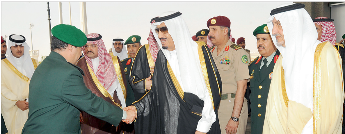
الأمير سلمان يصافح مودعيه في مطار الملك عبدالعزيز، ويبدو الأميران خالد الفيصل ومشعل بن ماجد.