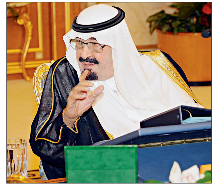
خادم الحرمين الشريفين في جلسة مجلس الوزراء.