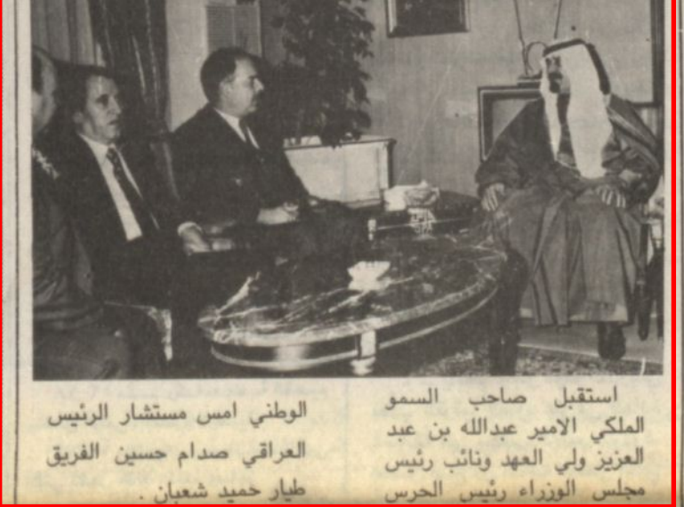
استقبل صاحب السمو الملكي الامير عبدالله بن عبد العزيز ولي العهد ونائب رئيس مجلس الوزراء رئيس الحرس الوطني امس مستشار الرئيس العراقي صدام حسين الفريق طيار حميد شعبان

سمو ولي العهد يستقبل مستشار الرئيس العراقي