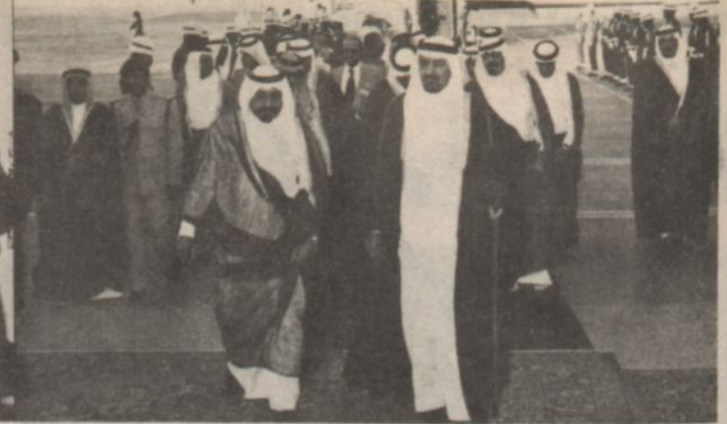
لقطة من استقبال الفهد لوزير البلاط والائمة ومعالى السيد احمد سوود رئيس الديوان الملكى المغربى