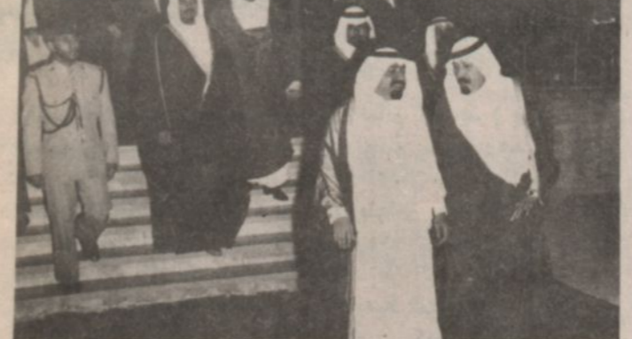
سمو الامير عبد الله بن عبد العزيز لى توديعه لسمو امير دولة قطر