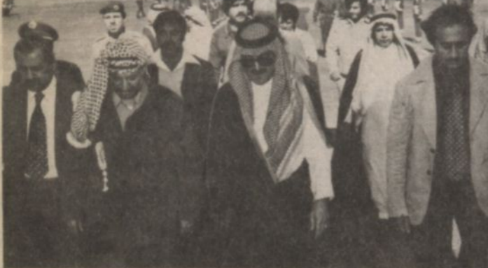
سمو الامير سطايم بن عبد العزيز لى استقباله للسيد ياسر عرفات يوم أمس