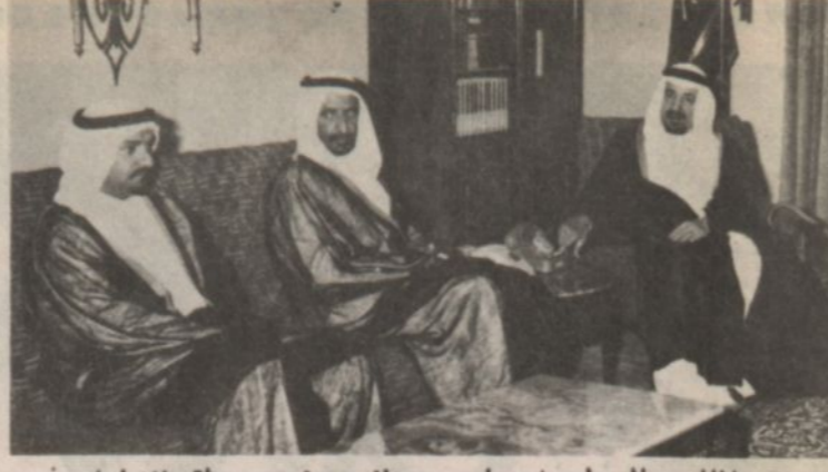
الملك خالد لى اجتماعه مع نائب رئيس دولة الامارات العربية الشيخ راشد بن مكتوم