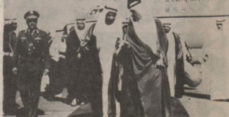
لقطة من وصول سمو الشيخ راشد بن مكتوم حيث كان فى استقباله سمو الامير عبد الله