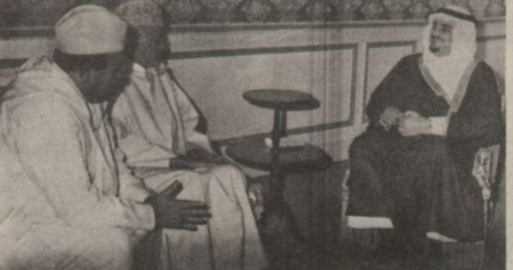
لقطة من استقبال الفهد لوزير البلاط والائمة ومعالى السيد احمد سوود رئيس الديوان الملكى المغربى