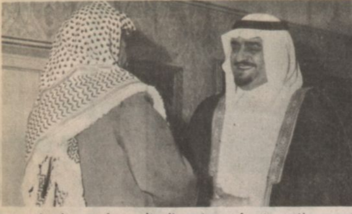
سمو الامير فهد لى استقباله السيد ياسر عرفات في جدة يوم أمس