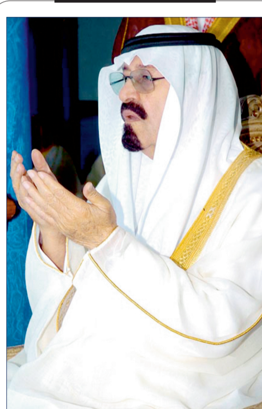
من نعزي فيك يا وافي الضلال أمتك ولا الأمم كل الأمم الأكيد أنك تعيش ولا تزال في قلوب الناس يا رأس الهرم مواطن

أولى الملك الإنسان خادم الحرمين الشريفين الملك عبدالله بن عبدالعزيز -رحمه الله- الأعمال الإنسانية جل اهتمامه في الداخل والخارج من خلال إنشاء مؤسسة خادم الحرمين الشريفين الملك بن عبدالعزيز آل سعود العالمية للأعمال الإنسانية والتي نفذت مشاريع إنسانية كبيرة ومنها مشروع جمعية «كلانا» الخاص بمرضى الكلى في جميع مناطق المملكة لعشرات الآلاف من مرضى الكلى ومرضى السكري المهديين بتقلص وفئات الكلية لديهم في الأعوام القادمة، حيث