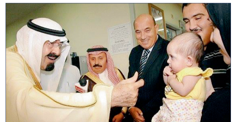
الملك عبدالله -يرحمه الله- يدايع أحد الأطفال.