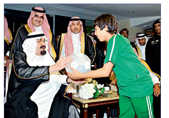
الملك عبدالله -يرحمه الله- خلال افتتاح ملعب الجوهرة.

شعبه، وهذه الصورة تحمل واحدا من أكثر المشاهد التي ترسخت في عقول أبناء هذا الوطن وأذهانهم، حين قدم رحمه الله قلمه الشخصي هدية للطفل فيصل الغامدي الذي يبكي اليوم رحيل قلبه الإنساني وحبب الشعب كما هو حال بقية المواطنين والمقيمين على هذه الأرض، ويسترجع تلك الذكرى قائلا أتألم كثيرا وأنا أتذكر تلك اللحظات ولا أمك إلا الدعاء له بالرحمة والغفران، كانت إنسانيته معي وتعامله بغفوية دافعا لي لكسر التوتر الذي صاحبني حينها وأنا في حضرة الملك (يرحمه الله)، قدم لي قلمه هدية ولم أشعر بوجود أي حاجز بيني وبينه، كانت هذه المبادرة الصادقة منه تأكيدا على نواضعه مع شعبه وحببه لهم، رحمه الله رحمة واسعة حملنا في قلبه وسبقني في قلوبنا.