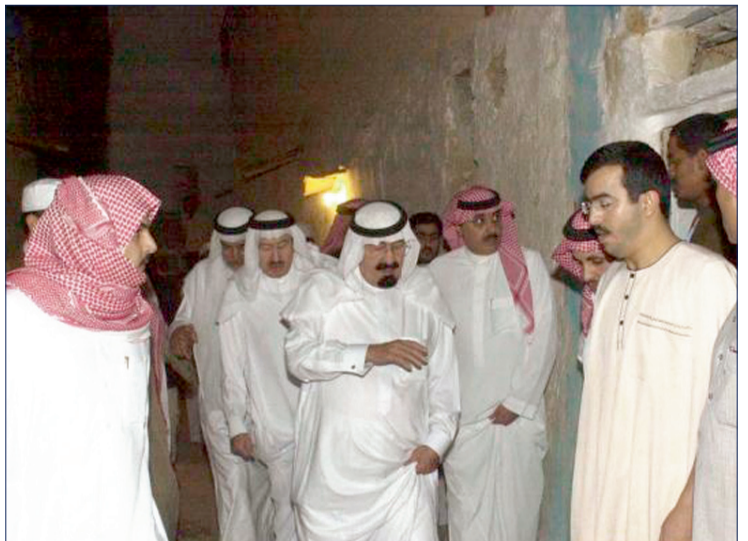
الملك الراحل خلال زيارته لحي منقوحة في الرياض.

تلمس خادم الحرمين الشريفين الملك عبدالله بن عبدالعزيز -يرحمه الله- أحوال الفقراء والمساكين قبل أن يتولى مقاليد الحكم وخصوصا القاطنين في الأحياء القديمة والشعبية وزيارته الشهيرة لحي منقوحة في الرياض عام ١٤٢٣هـ أكبر شاهد على ذلك، فقد تركت