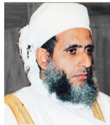
الشيخ أحمد الخليلي

المفتي العام لسلطنة عمان الشيخ أحمد بن حمد الخليلي أكد أن دعوة خادم الحرمين الشريفين الملك عبدالله بن عبدالعزيز -حفظه الله- تؤكد اهتمامه بالانفتاح على الآخر الذي يدعو إليه القرآن الكريم مشيراً إلى أنها دعوة تدل على إدراكه -وفقه الله- لما تتطلبه مصلحة الأمة التي إذا انفصلت عن نفسها كانت أمة هزيلة موضعاً أنها إضافة للانجازات التي يقوم بها خادم الحرمين الشريفين مما يدل على اهتمامه وإيمانه الشديدين بمدى أهمية وقيمة الحوار لتحقيق الخير لكل البشرية.