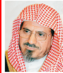
د. صالح بن حميد

رئيس مجلس الشورى الدكتور صالح بن حميد أكد أن دعوة خادم الحرمين الشريفين للحوار من أجل خير الإنسانية حيث رأى -حفظه الله- بأن الناس في العالم يحتاجون في الوقت الحالي إلى وقفة جادة في ظل المتغيرات المتسارعة والتفكك الأسري الذي يسود العالم كله فدعا المؤثرين على مستوى العالم والإنسانية جمعاء إلى أن يتنادوا ويسعوا في إنقاذ البشرية بالحوار مشيراً إلى أن الدين الإسلامي يدعو إلى الحوار والمجادلة بالتالي هي أحسن بين كل الفئات.