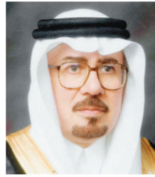
د. نزار مدني

وزير الدولة للشؤون الخارجية الدكتور نزار بن عبيد مدني أكد أن دعوة خادم الحرمين الشريفين للحوار هدفت لإزالة حالة الاحتقان التي تعيشها المجتمعات الإنسانية ومعالجة حالات الظلم والعداوة والكراهية ومواجهة ظواهر التطرف والعنف ومحاولة إقصاء الآخر مشيراً إلى أن أهمية هذه الدعوة تكمن في كونها تأتي في ظل ظروف دولية بالغة الدقة شهدت بروز معطيات جديدة ومقولات صدامية كصراع الحضارات وصراع الأديان والثقافات.