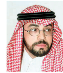
د. توفيق السديري

وكيل وزارة الشؤون الإسلامية لشؤون المساجد والدعوة والإرشاد الدكتور توفيق السديري أكد أن الدعوة الكريمة للحوار التي أطلقها خادم الحرمين الشريفين -حفظه الله- هي بداية الطريق للنقلة المطلوبة ولكي تبدأ الأمة الإسلامية بوضع أقدامها على الطريق الصحيح بين الأمم وأوضاع أن الوقوف أمام تجربتنا السابقة وترائنا فيما يتعلق بالحوار ودراسة واقعا خطوة مهمة لاستشراف آفاق المستقبل. تعقبها خطوات للبدء في نقلة جذرية للحوار ترتكز فيها على أساس شرعي صلب مضيفاً بقوله إن ما نراه اليوم من اهتمام في مختلف الأوساط الإسلامية بالحوار إدراك لأهميته وفي مقدمة ذلك الدعوة الكريمة التي أطلقها خادم الحرمين الشريفين.