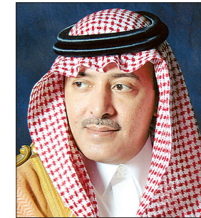
الأمير فيصل بن عبدالله

رئيس هيئة الهلال الأحمر السعودي، تقديراً لجهوده سموه الإنسانية. وقد تسلم الجائزة نيابة عن سموه نجله صاحب السمو الملكي الأمير عبدالله بن فيصل بن عبدالله بن عبدالعزيز آل سعود رسمي إقامته الشبكة بالعاصمة المنامة، تحت رعاية سمو الشيخ عبدالله بن خالد آل خليفة رئيس المجلس الأعلى للشؤون الإسلامية بمملكة البحرين، لتكريم ٦ شخصيات يمثلون كل دولة من دول مجلس التعاون،