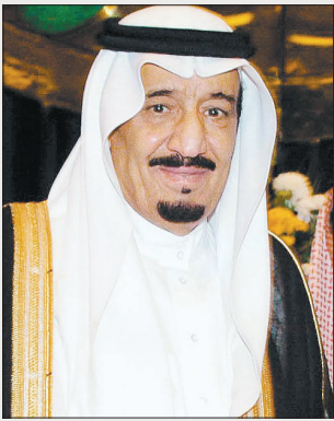
الأمير سلمان بن عبدالعزيز

واسى صاحب السمو الملكي الأمير سلمان بن عبدالعزيز ولي العهد نائب رئيس مجلس الوزراء وزير الدفاع أسرة الفرج بالأحساء في وفاة رجل الأعمال فرج بن سعد الفرج، وأعرب سموه في برقية بعثها لأسرة الفرج عن خالص تعازيه، داعياً الله أن يتغمد الفقيد بواسع رحمته ويسكنه فسيح جناته.