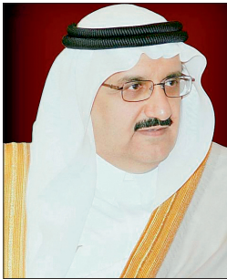
الأمير د. منصور بن متعب

هذه الجهات على أداء مهامها وفق خطط وبرامج التنمية الوطنية، مؤكداً أن الوزارة تحرص على أداء دورها التكاملي مع جهود الأجهزة الحكومية ذات العلاقة ومنها وزارة الإسكان لتزويدها بكافة احتياجاتها من الأراضي لتوفير السكن للمواطنين. وبين أن القرار تضمن توجيه أمانة منطقة الرياض لاستكمال الإجراءات النظامية ومخاطبة كتابة العدل لإفراغ مساحة الأرض التي تم تخصيصها لإنشاء المشروع السكني، بقطعة الأرض الواقعة شرق مدينة الرياض، وتسجيلها باسم أملاك الدولة لصالح وزارة الإسكان التي ستؤول بدورها عمل