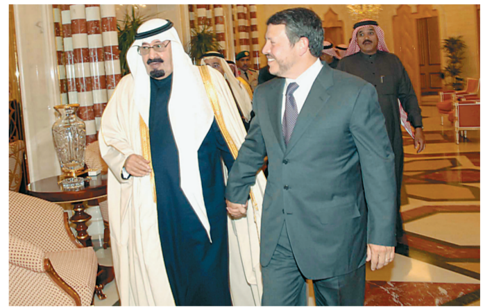
خادم الحرمين الشريفين لدى استقباله العاهل الأردني