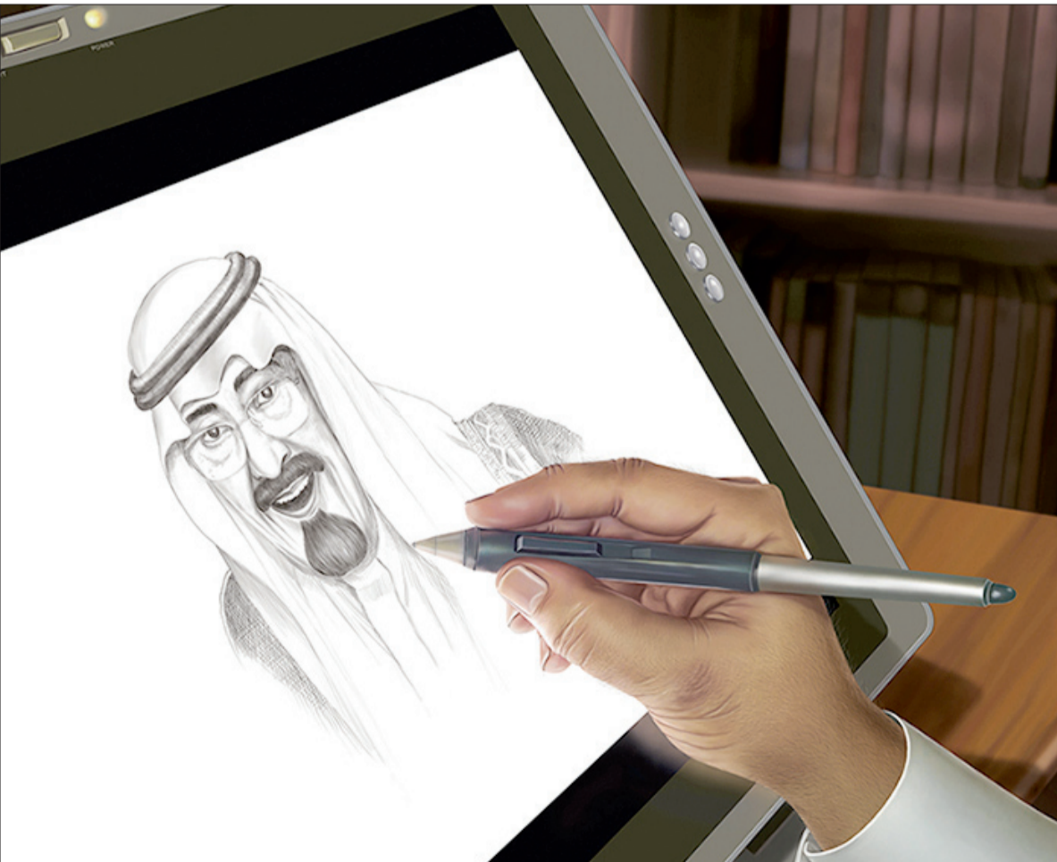
وتشكيلي يضع اللمسات الأخيرة مستخدما التقنيات الحديثة.