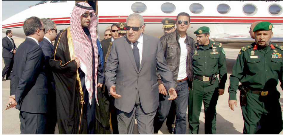
رئيس وزراء مصر إبراهيم محلب يصل الرياض للمشاركة في مراسم تشييع الملك عبدالله.

وقال نائب رئيس الوزراء الأسبق الدكتور يحيى الجمل: لقد رحل حكيم العرب وملك الإنسانية، وستظل سيرته العطرة بما قدم سواء لشعبه أو لسائر الشعوب العربية والإسلامية في سجله الناصع إلى يوم القيامة. من جانبه، قدم عمرو موسى الأمين العام السابق لجامعة الدول العربية، تعازيه إلى الدول العربية والإسلامية على فقدان رجل بقامة الملك عبدالله،