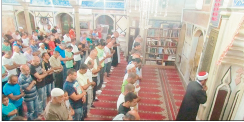
لبنانيون يؤدون صلاة الغائب على فقيد الأمة الملك عبدالله.

وأضاف الوزير ريفي: لقد كان للمغفور له الملك عبدالله بن عبدالعزيز رؤية سياسية استراتيجيّة، ففي الوقت الذي كرس جهدا خاصا للتنمية داخل المملكة فطرح إلى إنشاء مركز حوار الحضارات كان غيره في هذا الوقت يدعو إلى صراع الحضارات. وأضاف: لا يمكن أن ننسى ما قدمه المغفور له على صعيد مكافحة الإرهاب حين دعم مركز الأمم المتحدة، حيث كانت له رؤية لكيفية أن تتخلص البشرية من