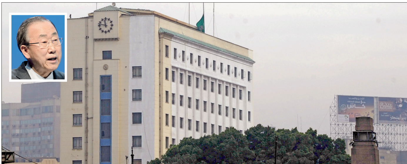
الجامعة العربية تنكس أعلامها وفي الاطار أمين عام الامم المتحدة بانكي مون.

أكد الأمين العام للأمم المتحدة بان كي مون أن المملكة حققت تحت قيادة الملك عبدالله بن عبدالعزيز لبلاده تقدما ملحوظا ورخاء لشعبها. وقال في بيان أمس: إنه يعبر عن تعازيه للأسرة المالكة وحكومة وشعب