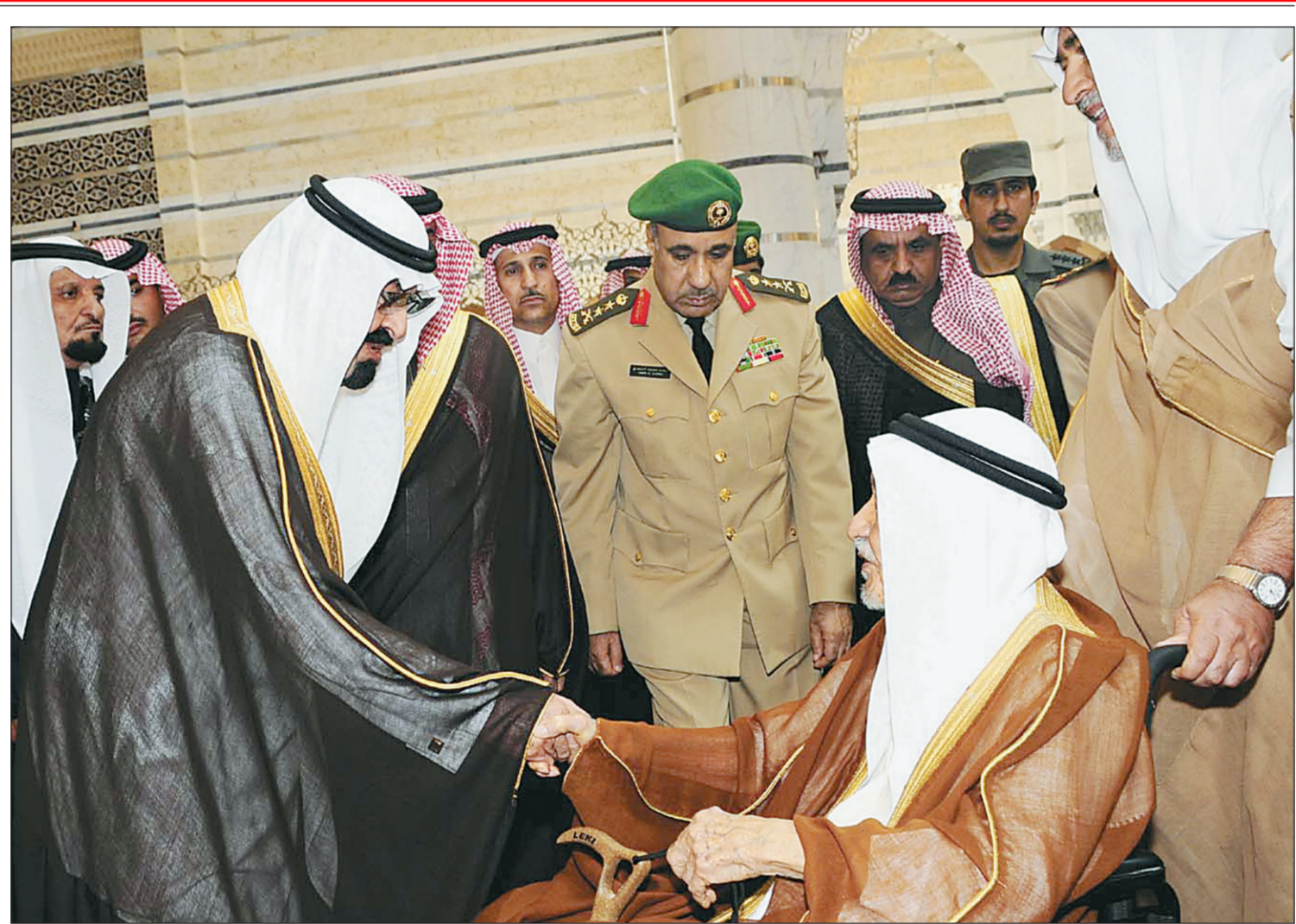
خادم الحرمين الشريفين يصافح أحد مودعيه في مطار الملك عبدالعزيز أمس لدى مغادرته جدة إلى روضة خريم.

فلح الذبياني جدة - بين رئيس مجلس الشورى الدكتور صالح بن حميد لـ «عكاظ» أن المجلس سيزيد عدد المستشارات فيه، وفيما تحفظ ابن حميد على إعطاء رقم للزيادة على المستشارات الست حاليا، اكتفى بالإشارة إلى أن الحالات يحضرين ويبدون رأيهم بكل شفافية ووضوح، ولكنهن لا يصوتن. على صعيد ذي صلة، أوضح الدكتور ابن حميد أن تغيير نصف أعضاء مجلس الشورى على الأقل سيتم قبل بداية الدورة الشورية الجديدة التي تنطلق بعد ٧٥ يوما، وبالتحديد في الثالث من ربيع الأول المقبل، وفيها يوجه خادم الحرمين الشريفين الملك عبدالله بن عبدالعزيز خطابا للأمة يحدد خلاله السياسات الداخلية والخارجية للمملكة، ويرسم خريطة عمل للمجلس، واعتبر رئيس مجلس الشورى أي نقد يوجه للوزراء الذين يستضيفهم المجلس ويناقشهم تحت قبته «لا يعني المساس بهم أو إنكار الإيجابيات» (صفحة ٤)