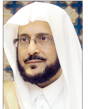
د. عبداللطيف آل الشيخ

أكدت الرئاسة العامة لهيئة الأمر بالمعروف والنهي عن المنكر على جميع منسوبيها في كافة مناطق المملكة عدم التصريح لوسائل الإعلام عن القضايا التي تباشرها الهيئة إلا من خلال المتحدثين الإعلاميين للفروع بعدما لاحظت ذلك. وجاء ذلك في تعميم موقع من قبل الرئيس العام لهيئة الأمر بالمعروف والنهي عن المنكر الدكتور عبداللطيف آل الشيخ (حصلت «عكاظ» على نسخة منه)، تضمن التأكيد على الجميع بالامتناع عن نشر أو تسريب أية معلومة لوسائل الإعلام الإلكترونية والمقروءة وغيرها، عن القضايا والجرائم التي يتم ضبطها بمعرفة رجال الهيئة، وذكر بعض تفاصيلها والتي غالباً ما يجانبها الصواب، ولفت التعميم إلى أن ذلك يتعارض مع مبدأ الستر على الناس وحفظ حرمتهم.