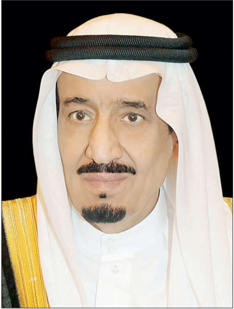
الأمير سلمان بن عبدالعزيز

سركيسيان رئيس جمهورية أرمينيا، وفخامة الرئيس الدكتور جورج أبيليا رئيس جمهورية مالطا، بمناسبة ذكرى استقلال بلديهما. وأعربا باسميهما واسم شعب وحكومة المملكة العربية السعودية عن أصدق التهاني، وأطيب التمنيات بموفور الصحة والسعادة ولشعبها وبالصحة والسعادة لفخامتهما، ولشعبي أرمينيا ومالطا الصديقين اطراد التقدم والازدهار.