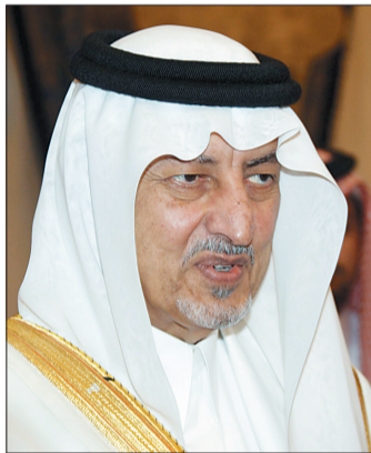
الأمير خالد الفيصل

وتم تخصيص الحي الجامعي جنوب ذهبان للبنين والآخر داخل مدينة جدة للبنات، وفي عام ٢٠٠٨م بدأت الكلية في تقديم أول برنامج للدراسات العليا في إدارة الأعمال، كما تم افتتاح كلية الهندسة وتقنية المعلومات، ثم في عام ٢٠١٠م صدرت موافقة الوزارة على افتتاح كلية الإعلان والتي سبقت الدراسة فيها مع بداية الفصل الدراسي الثاني المقبل (فبراير ٢٠١٣م)، مضيفاً أن