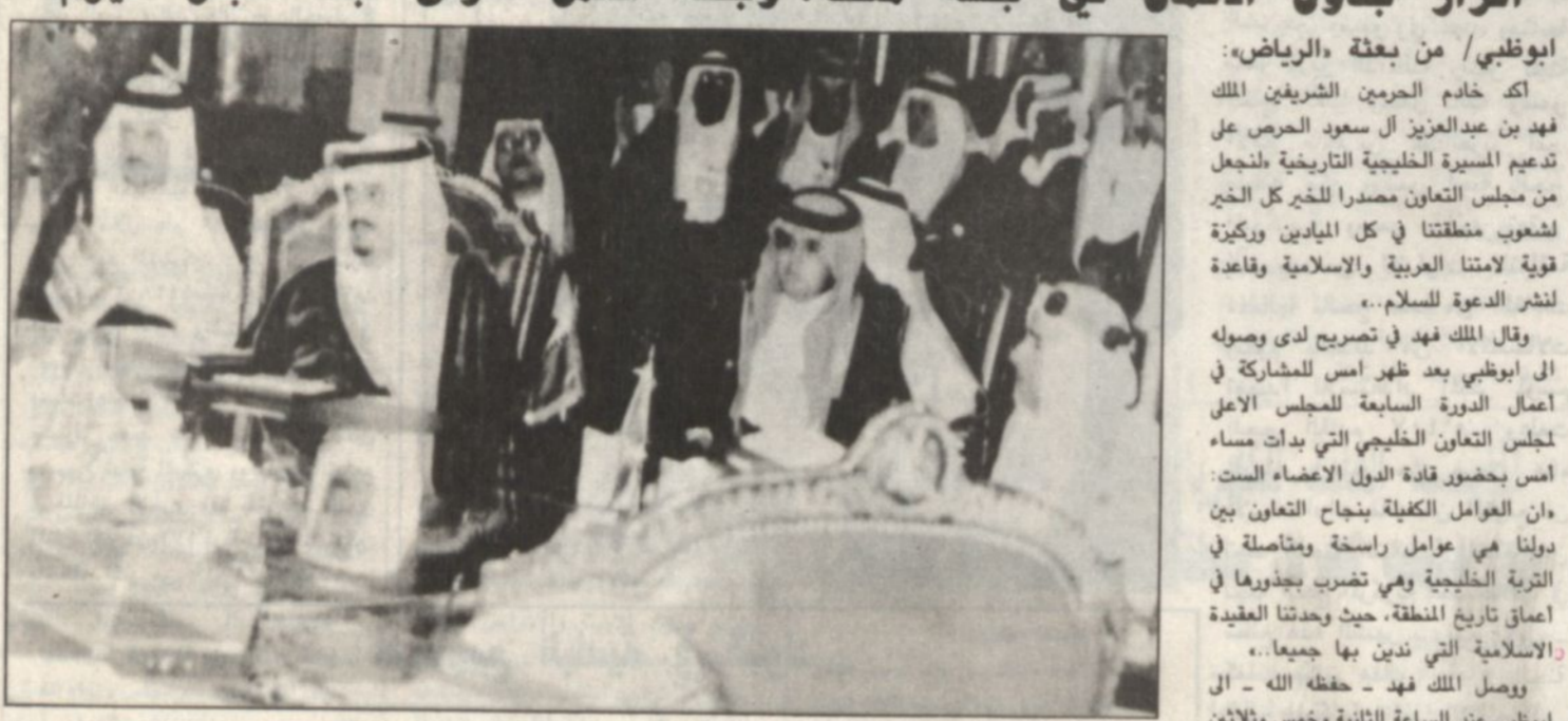
الأمير سلطان والوزير فيصل بن عبدالعزيز مع أعضاء المجلس العربي للجامعة الإسلامية في ابوظبي

«لقد عقدنا العزم على ان نجعل من هذا المجلس مصدراً خيراً شعوبنا.. وركيزة قوية لأمتنا العربية والاسلامية» اترار جدول الأعمال في جلسة مفصلة، وجلسة العمل الأولى تبدأ صباح اليوم