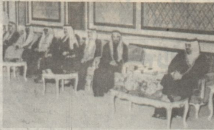
خادم الحرمين الشريفين يستقبل العلماء والمواطنين