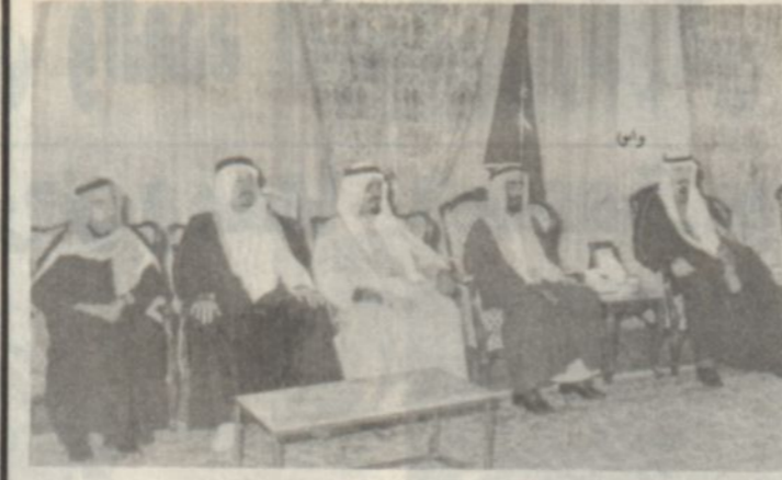
سمو ولي العهد لدى استقباله الشيخ عبدالعزيز النعيمي..