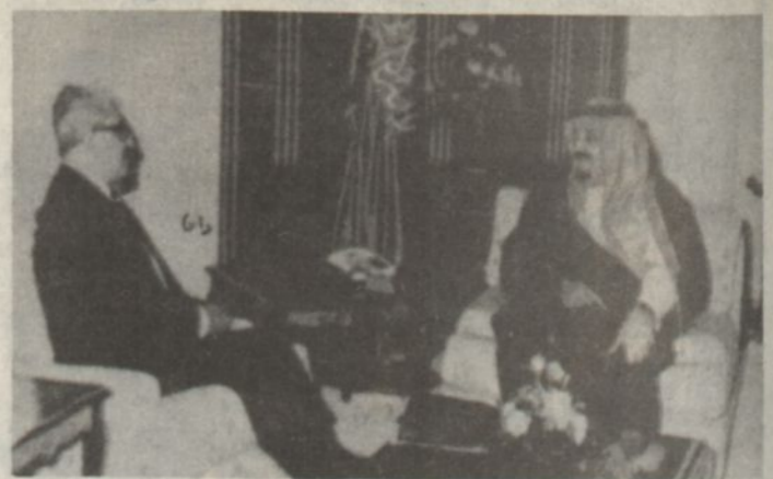
خادم الحرمين الشريفين لدى استقباله السيد طارق عزيز امس..