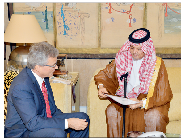
الأمير سعود الفيصل مستقبلاً السفير غيرت كريل.