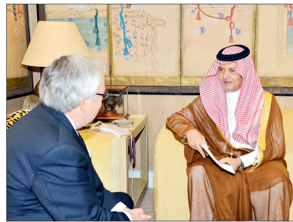
ومستقبلاً السفير رولف ولي هانسن أمس في جدة. (واس)