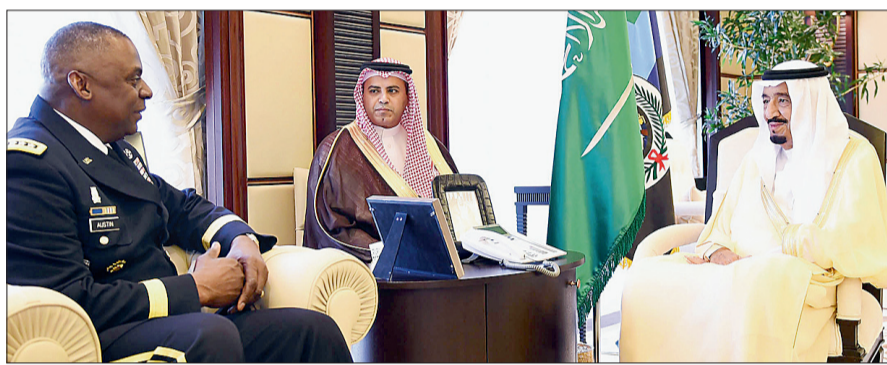
الأمير سلمان مستقبلاً قائد القيادة المركزية الأمريكية أمس في جدة.