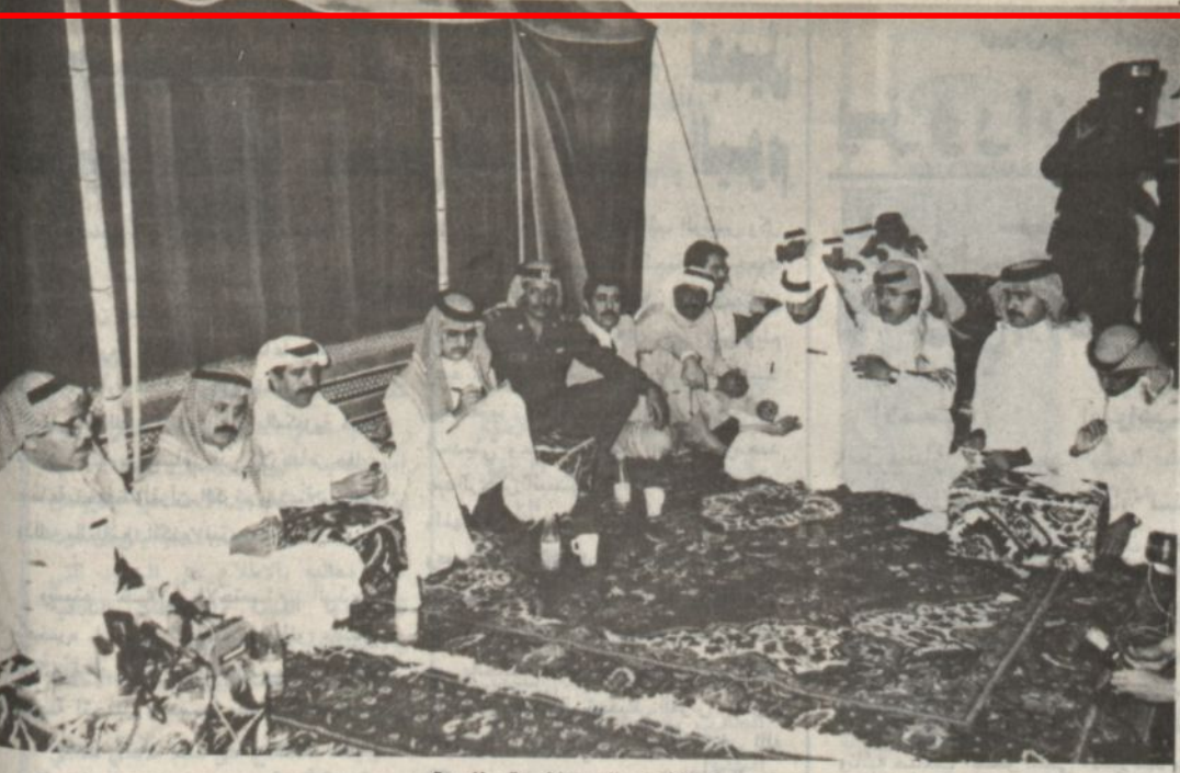
المؤتمر الصحافي بالجنادرية

وعن الجديد في لجنة الاستقبال هذا العام كما تحدث عنها قائلا: ان اللجنة