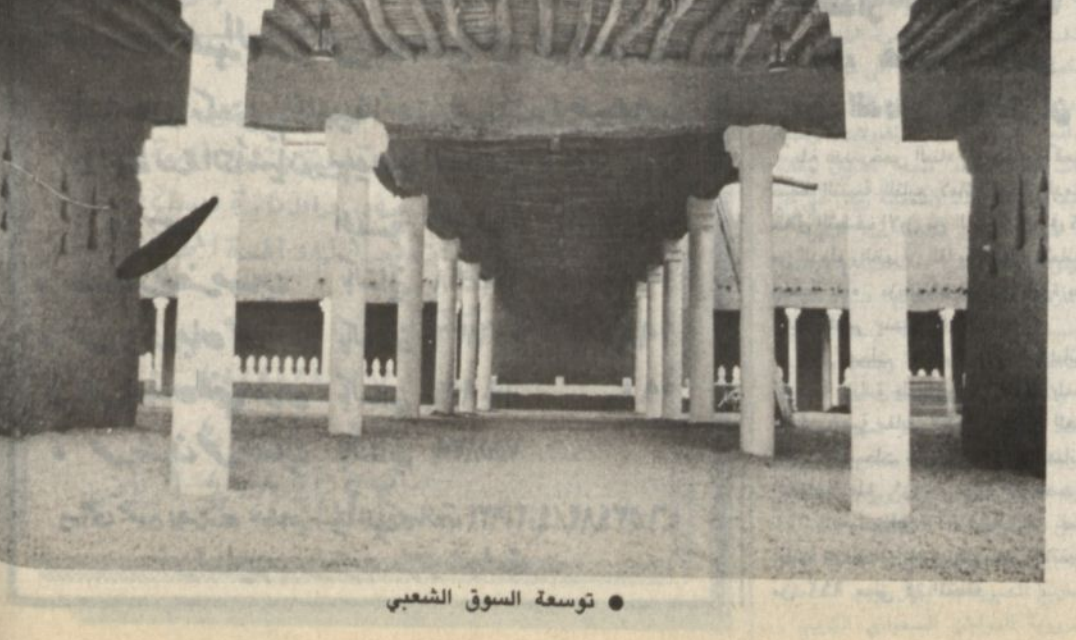
توسعة السوق الشعبي