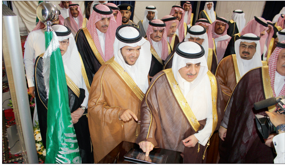
الأمير فهد بن سلطان ي دشن مشروعاً في جولته على محافظات منطقة تبوك.

من ناحية أخرى وقف الأمير فهد بن سلطان أمير منطقة تبوك ميدانياً أمس الأول على مشروع المباني العاجلة للكلية الجامعية للبنات بمحافظة حقل التابعة لجامعة تبوك واستمع سموه إلى شرح من وكيل الجامعة الدكتور عطية