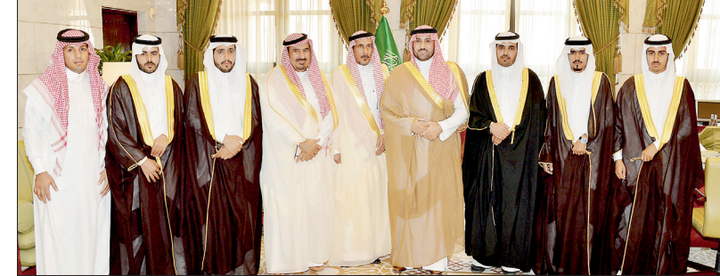
الامير تركي بن عبدالله يستقبل المواطن ماهر البلوي وإخوانه المنازلين عن دم أخيهيم.

البلوي وإخوانه، عن قاتل أخيهيم أحمد بن عويض البلوي -رحمه الله-، لوجه الله تعالى، ثم لشفاة خادم الحرمين الشريفين الملك عبدالله بن عبدالعزيز آل سعود -حفظه الله-، وذلك أمام صاحب السمو الملكي الأمير تركي بن عبدالله بن عبدالعزيز أمير منطقة الرياض خلال استقبال سموه لهم في مكتبه بقصر الحكم أمس.