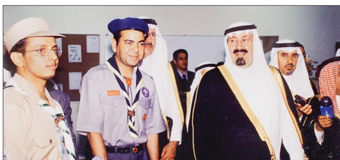
الملك عبدالله في إحدى مناسبات الكشافة.

● وما خطط وبرامج الجمعية خلال العام الدراسي الجاري ؟ ● لدينا استراتيجية موزعة على جميع القطاعات الكشافية، وهناك برامج تنفذ أثناء بداية الدراسة، مثل الشارات التي نكرتها في إجابة السؤال السابق، وجميعها تقام في بداية العام الدراسي في جميع الفرق الكشافية وفرق الجامعات، وكذلك لدينا المشروع الكشفي للاحتفاء باليوم الوطني، ويتم خلاله الاحتفال باليوم الوطني عن طريق مشاريع تنفذ على مستوى الكشافة (الفرد)، ومستوى الفرقة، ومستوى المحافظة، أو الجامعات، ويتم في اليوم الوطني تكريم المشاركين ومنحهم الشارات، وعقب مشروع اليوم الوطني تبدأ الكشافة في مشروع خدمة ضيوف الرحمن في المدينة المنورة والمشاعر المقدسة ومكة المكرمة، وكذلك في المنافذ البرية والبحرية والجوية، وسيكون هناك دورات تدريبية للمشاركين في خدمة ضيوف الرحمن، وعقب ذلك يبدأ مشروع البيئة والإعلان عنه وبدء خطط تنفيذ المشروع بجمع جوانبه سواء في التوعية أو نظافة البيئة أو غرس الأشجار والحد من التلوث وغير ذلك من الجوانب المتصلة بالبيئة، وهذه تقام في ظل مشروع رسل السلام، والذي يحمل اسم خادم الحرمين الشريفين، والمملكة تقود العالم في هذا المشروع، حيث يشارك فيه أكثر من ١٥٠ دولة، وبلغ