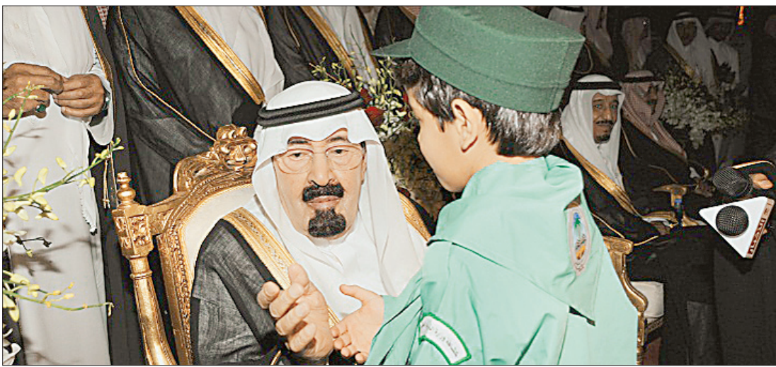
خادم الحرمين الشريفين يصفح طفلاً كشافياً.