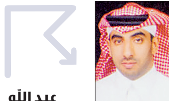
عبد الله الفايدي (الرياض)

كشف نائب رئيس الجمعية العربية السعودية للكشافة البروفيسور عبداللّه بن سليمان الفهد عن تنفيذ عدد من البرامج التي تستهدف تنمية الانتماء الوطني والتوعية ضد الارهاب والتطرف، وذلك ضمن الاستراتيجية الشاملة للتوعية التي تنفذها الجمعية، مؤكداً في حديثه لـ «عكاظ» تنفيذ عدد من المشاريع الوطنية لمساعدة ١٠٠ أسرة في حاله ضمن احتفالات الجمعية باليوم الوطني، ومنح ١٥٠ شارة للمشاركين في المشروع، مشيراً إلى اعتماد عدد من البرامج المختلفة لخدمة المجتمع والبيئة وضيوف الرحمن سيتم تنفيذها خلال العام الجاري. وقال الفهد ان عدد المنتميين للجمعية العربية السعودية للكشافة بلغ ١٦٠ ألف كشاف، موضحاً عدم وجود أي قيود امام الراغبين في الالتحاق ببرامج الجمعية، مشيداً بما حققه مشروع رسل السلام العالمي، مؤكداً تسجيل أكثر من نصف مليار ساعة عمل قدمها أكثر من ١٠ ملايين عضو في المشروع من ١٥٠ دولة، وفيما يلي نص الحوار ..