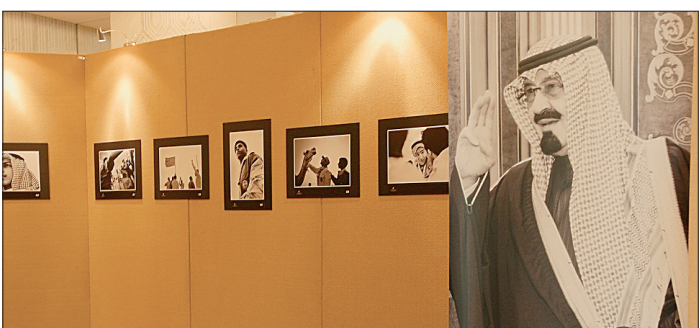
و.مؤديا التحية الكشافية.

التربية والتعليم، وهناك مشروع نظافة البيئة، وفي هذا العام تم رفع أكثر من ٤٠٠ طن من البلاستيك في أنحاء المملكة، وتم معالجة بعضها بالتنسيق مع عدد من الجمعيات الخيرية. ● في ظل الدعم الكبير الذي حظي به التعليم والتوجه نحو تفعيل التقنية في برامج وأعمال كافة المدارس .. ما المتوقع من الكشافة لمواكبة التقدم التقني ؟ ● جمعية الكشافة، هي جمعية مدنية ذات شخصية اعتبارية، وليست لها ميزانية معتمدة سوى إعانة سنوية محددة، ومع ذلك فإن الجمعية تسبق القطاعات في عملها، فعلى سبيل المثال، في الجانب التقني حولت الجمعية ومنذ سنوات ومنح الشهادات، ولديها متطوعون متخصصون في هذا الجانب، ومنذ سنوات والجمعية في عملها في الحج لا تتعامل ورقياً نهائياً، ولذلك سبقت الكشافة كثير من القطاعات، ولقد كان لصاحب السمو الملكي الأمير عبدالجيد بن عبدالعزيز (رحمه الله) كلمة مشهورة ظل يرددتها على مدى ١٢ عاماً، قال فيها «الكشافة تعمل على أعلى مستوى وتنسق جميع القطاعات في الجوانب التقنية»، وهذا راجع للجهد الطوعي الذي يبذله أعضاء الكشافة، ومن الأعمال التقنية استخدام خرائط الكترونية في المشاعر المقدسة.