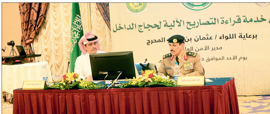
اللواء عثمان المحرج مدشن خدمة قراءة تصاريح الحج أمس.