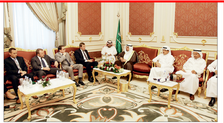
نائب رئيس مجلس الشؤون مستقبلاً وفد الكونغرس الأمريكي.

التقى صاحب السمو الملكي الأمير سلطان بن سلمان بن عبدالعزيز رئيس الهيئة العامة للسياحة والآثار في مقر الهيئة بالرياض أمس، صاحب السمو الملكي الأمير فيصل بن سلمان بن عبدالعزيز أمير منطقة المدينة المنورة رئيس مجلس التنمية السياحية بالمنطقة، الذي يزور الهيئة لمناجاة سير العمل في عدد