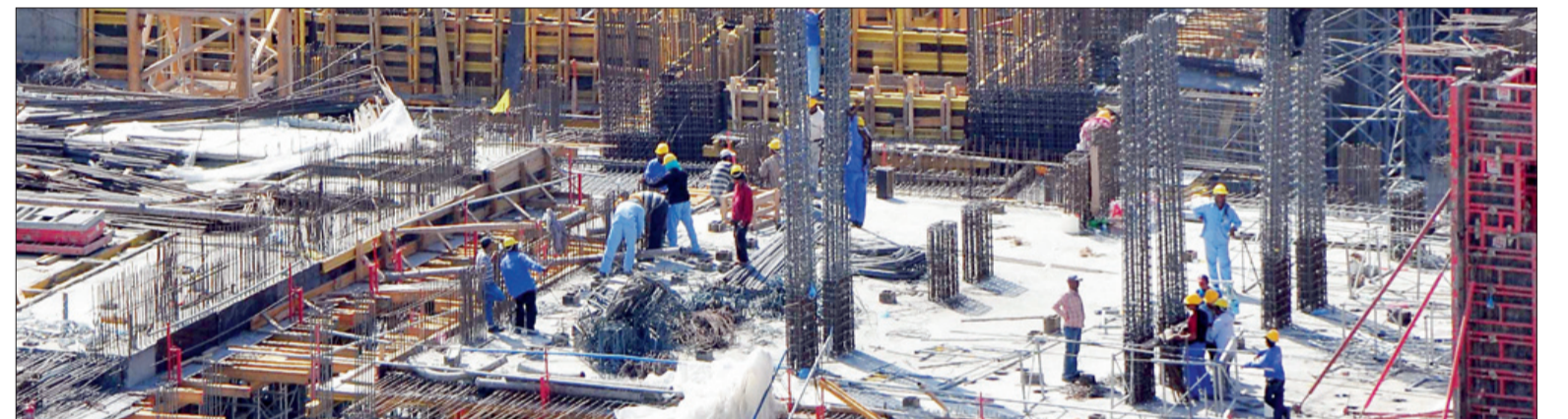
حركة دؤوبة من العمل.