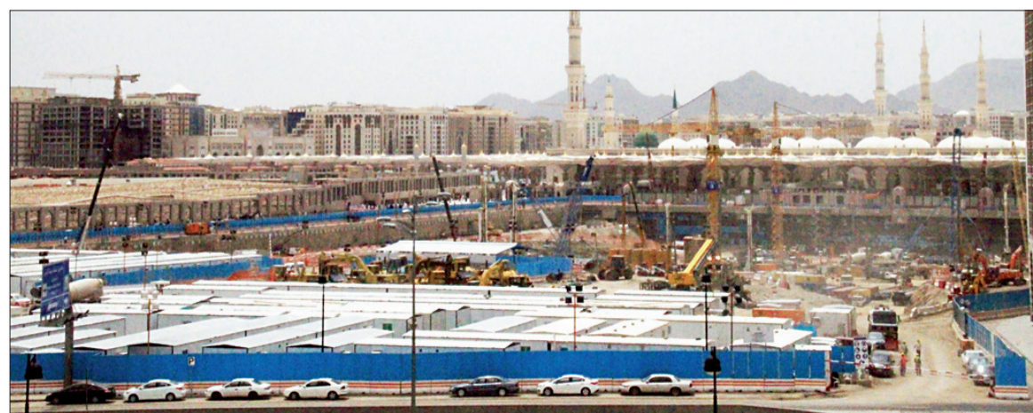
مشروع التوسعة للمسجد النبوي الشريف.

وتعتبر الحاجات الروحانية المرتادي المسجد النبوي الشريف وبالتالي التطوير العام للمنطقة المركزية ذات أهمية كبرى، ولاشك أن مرتادي المسجد الشريف يريدون الإقامة على مقربة من المنطقة المركزية نظراً لأن المشي يكون ممكناً لهم، من وإلى