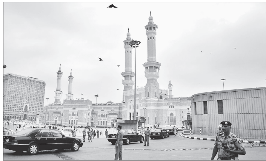
حمام السلام يبرفر على مأذن الحرم الذي يحضن الحوار الفلسطيني

ومن أجل أسرنا وأسرانا الذين ينظفون إلى وحدتنا وإلى إنطلاقة جديدة لمسيرة العمل الوطني ووفاء لدماء شهدائنا الذين غنوا هذا الطريق المبارك واختطلت دماؤهم الفتاوى والحماسية ومن الفصائل المباركة ومن أجل جرحانا ومعوقينا ومن أجل جماهير أمتنا العربية والإسلامية الذين تعتبر فلسطين والقدس والأقصى في قلوبهم وساءهم اختلافنا السياسي وساءهم اختلافنا في الميدان وما نرّف من دماء ماكان لها أن تنزف إلا في وجه العدو الصهيوني ، جنباً من أجل قضية الأقصى والقدس التي اليوم كما ذكر أخي أبو مازن العدو الصهيوني يستغل ظرفاً كثيرة ويقدم بهذه الخطوات الاعترافية على مقدساتنا وعلى أرضنا المباركة ، جنباً إلى هذا المكان المبارك من أجل أن يتفرغ الفلسطينيون وقادتهم وفصائلهم للملفات الكبيرة لاستعادة الأرض والحقوق وإقامة الدولة الفلسطينية ذات السيادة الحقيقية لإنجاز كل ملفاتها الأساسية في مواجهة الاستيطان والحدود وقضية القدس وحق العودة وتعزيز الجبهة الوطنية الداخلية، جنباً إلى هذا المكان بدعوة كريمة من خادم الحرمين الشريفين الملك عبدالله بن عبد العزيز ودعا إلى اجزى خادم الحرمين الشريفين خير الجزاء على هذه الدعوة الكريمة للاتحاد.