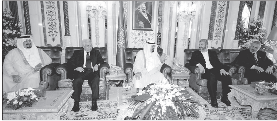
الملك لحي استقباله القادة الفلسطينيين بحضور سمو ولي العهد

استقبل خادم الحرمين الشريفين الملك عبدالله بن عبدالعزيز آل سعود حفظه الله في قصر الصفا بمكة المكرمة أمس فخامة رئيس السلطة الوطنية الفلسطينية محمود عباس ورئيس المكتب السياسي لحركة حماس خالد مشعل ودولة رئيس الوزراء الفلسطيني إسماعيل هنية وعدد من المسؤولين في حركتي فتح وحماس. وقد أقام خادم الحرمين الشريفين أيده الله مأدبة غداء تكريماً لاشاقته قادة