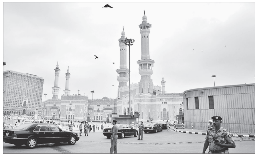
حمام السلام برفرف على مأذن الحرم الذي يحضن الحوار الفلسطيني

وفي بداية الاجتماع ألقى الرئيس محمود عباس أبو مازن كلمة أوضح فيها أن هذا الاجتماع في هذا المكان يأتي لنبحث أمورنا وقضايانا بعيداً عن الضجيج وتكون الأمور أكثر إمكانية للوصول إلى نتائج إيجابية، إن هذا المكان هو أفضل مكان على الأرض من مكة المكرمة ومن جوار الكعبة المشرفة لتلقي اليوم هنا لكي نبحث قضايانا وأمورنا الداخلية وبالتأكيد أن مجيئنا إلى هنا وراءه أمور أبرزها أننا نريد حل القضايا المشتركة في ما يتعلق بقضيتنا المشتركة وهي قضية الوحدة الوطنية التي نسعى جميعاً للوصول لها من خلال حل عادل وكذلك حاجة شعبنا في هذه الأيام للأمن والأمان بعد أن فقد، فكيف يمكننا حل مشاكلنا ونحن