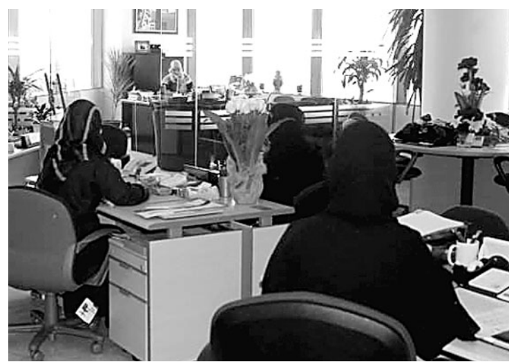
دور ملموس للمرأة السعودية في المجتمع