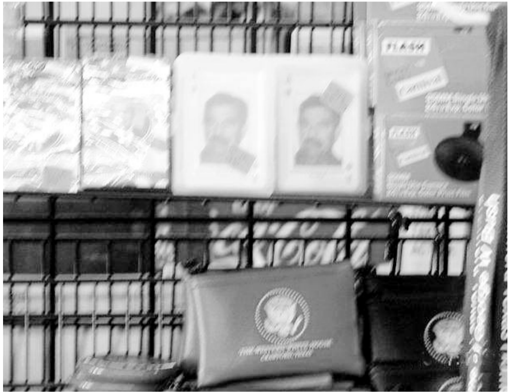
صدام على اوراق الكوشيتية في رفوف متاجر كروفورد بجانب جورج بوش