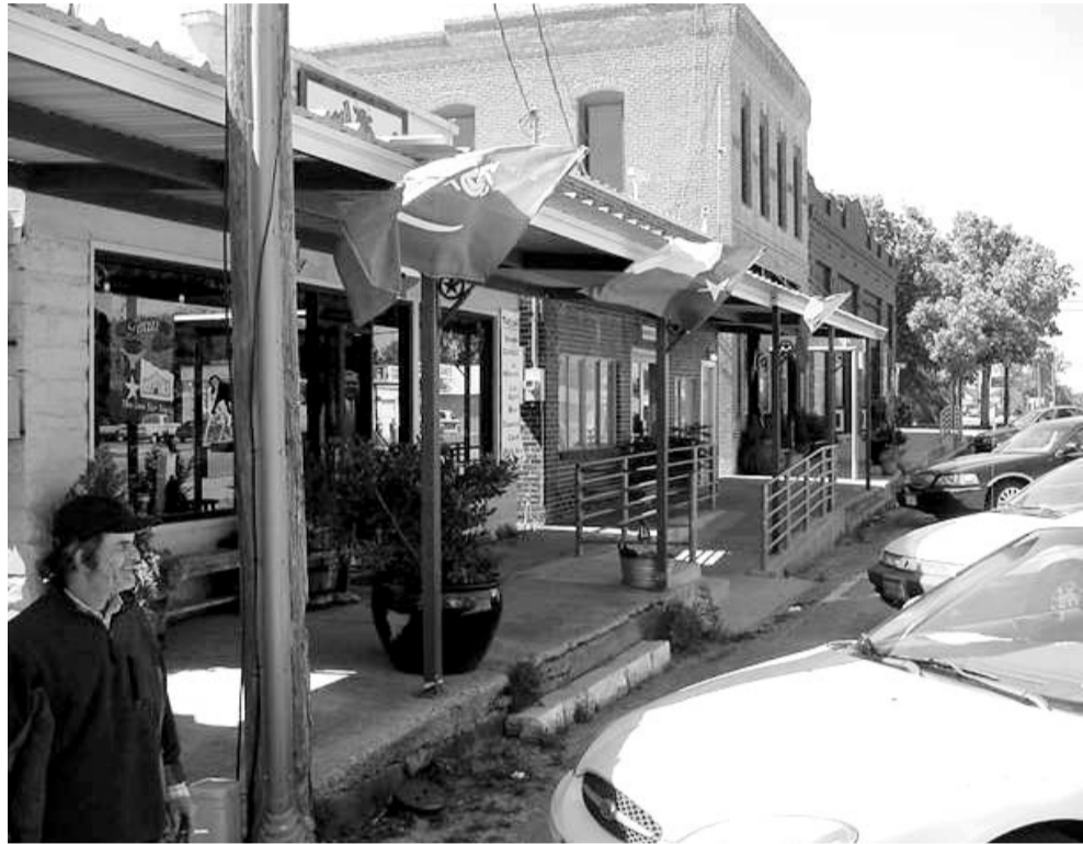
الاعلام السعودية في احد شوارع كروفورد