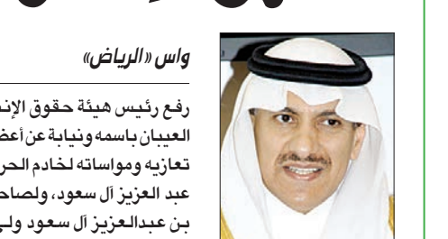
د. بندر العبيان

رفع رئيس هيئة حقوق الإنسان الدكتور بندر بن محمد العبيان باسمه ونياية عن أعضاء مجلس الهيئة ومنسوبيها تعازيه ومواساته لخادم الحرمين الشريفين الملك عبدالله بن عبدالعزيز آل سعود، ولصاحب السمو الملكي الأمير سلمان بن عبد العزيز آل سعود، ولي العهد نائب رئيس مجلس الوزراء وزير الدفاع، ولصاحب السمو الملكي الأمير مقرن بن عبدالعزيز آل سعود الثاني لرئيس مجلس الوزراء