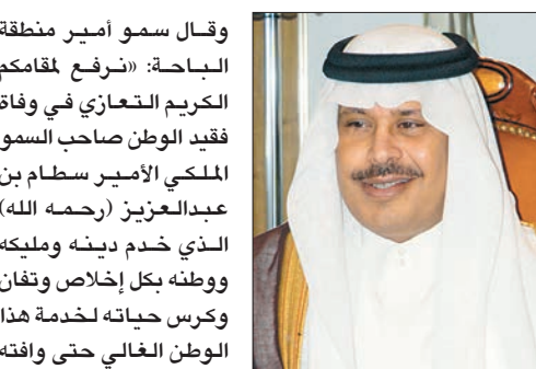
الأمير مشاري بن سعود

وقال سمو أمير منطقة الباحة: «شرف مقامكم الكريم التعازي في وفاة فقيه الوطن صاحب السمو الملكي الأمير سبطام بن عبد العزيز (رحمه الله) الذي خدم دينه ومليكته ووطنه بكل إخلاص وتفان وكبر حياته لخدمة هذا الوطن الغالي حتى وافته المنية. نسأل الله تعالى أن يتغمد