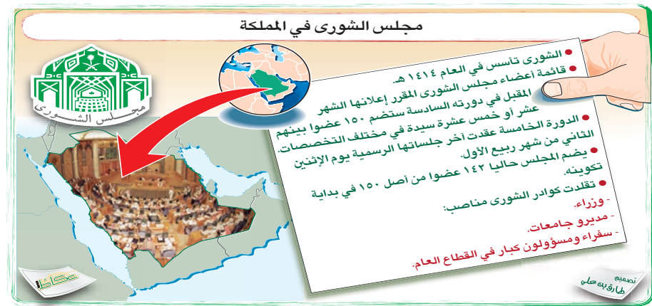
مجلس الشورى في المملكة

التشورى تأسس في العام ١٤١٤ هـ. قائمة أعضاء مجلس الشورى المقرر إعلانها الشهر المقبل في دورته السادسة ستضم ١٥٠ عضواً بينهم ١٢٠ عضواً من مجلس الشورى و٣٠ عضواً من خارج المجلس. تضم المجلس حالياً ١٤٢ عضواً من أصل ١٥٠ في بداية