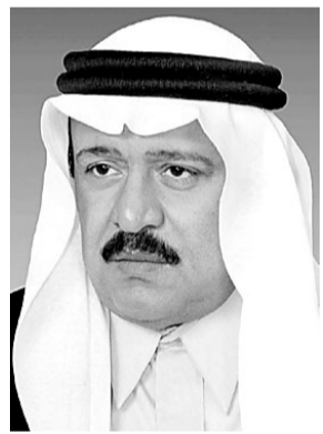
الامير محمد بن سعود

علي صمان (الباحة) عبر صاحب السمو الملكي الامير محمد بن سعود بن عبدالعزيز امير منطقة الباحة عن بالغ حزنه للمصاب الجلل في وفاة قائد المسيرة خادم الحرمين الشريفين الملك فهد بن عبدالعزيز رحمه الله . وقال ان فقده خسارة جسيمة للامتين العربية والاسلامية ولا يسعنا الا ان نقول «إننا لله وإنا إليه راجعون» ونعزي أنفسنا ونرفع خالص التعازي ويرحمه الله من جهود جبارة ونهضة شاملة بمختلف المناطق . موضحاً سموه ان مسيرة الخير والنماء والعطاء التي بدأها الملك المؤسس طيب الله ثراه تابعها من بعده ابناؤه البررة، وواصلها خادم الحرمين الشريفين غفر الله له الثمرت الكثير من الانجازات العملاقة.. وان شاء الله تستمر بتكاتف وتآزر القيادة الرشيدة والشعب السعودي بقيادة الملك عبدالله بن عبدالعزيز وسمو ولي عهده الامين الامير سلطان بن عبدالعزيز .