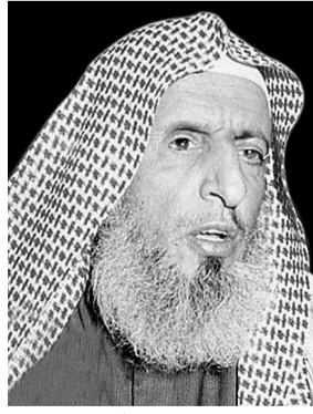
الشيخ عبدالعزيز آل الشيخ

آدم فلانة (الاستماع) أكد سماحة الشيخ عبدالعزيز آل الشيخ مفتي عام المملكة ورئيس هيئة كبار العلماء ورئيس البحوث والافتاء أن الملك فهد بن عبدالعزيز -رحمه الله- أمضى جل وقته في خير وإصلاح الأمة داعياً المولى عز وجل أن يتغمده برحمته ويسكنه فسيح جناته . وقال سماحته: أيها المسلمون في هذا اليوم «أس» انتقل خادم الحرمين الشريفين الملك فهد انتقل من هذه الدنيا إلى دار البرزخ نسال الله أن يجعل قبره روضة من رياض الجنة وأن يفسح له في قبره ونسال الله أن يجازيه عما قدم للإسلام والمسلمين خيراً.. أخوتي.. الموت حق ولا بد لكل فرد منا.. وإن رحيل الملك فهد مصاب علينا بالصبر والرضى عن الله، نتذكر أفعال ذلك الملك العظيم وأفعاله الطيبة ومشاريعه القيمة ومواقفه المشرفة وسهره الدؤوب في إصلاح هذا البلد وشأنه حتى مضى عليه هذا الوقت الطويل في خير وإصلاح وتخمينة فجزاه الله عما قدم خيراً.. إن له أيادي بيضاء على هذا المجتمع المسلم يذكره المسلمون دائماً فيسألون الله له الرحمة والتجاوز ويدعون له من أعماق قلوبهم أن يسكنه الله فسيح جنته ويعلي منزلته ويخلفه في أهله ثم إن مما أبعج النفس وأدخل السرور هذا الاتفاق العظيم على بيعة عبدالله بن عبدالعزيز ملكاً للمملكة وخامساً للحرمين الشريفين وعلى اختيار الملك