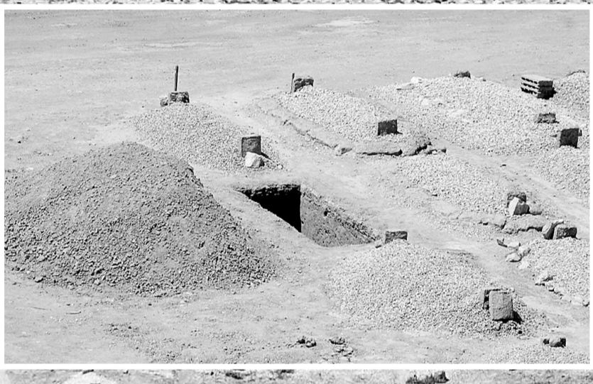
مقابر العود وفي الاطار القبر الذي سيوارى فيه جثمان الملك فهد

عبدالعزیز -غفر الله له- الى مؤواه . وسيكون قبره -يرحمه الله- قريباً من القبر الذي دُفن فيه ابنه الراحل الأمير فيصل بن فهد ومن قبور عدد من المواطنين الذين انتقلوا الى رحمة الله رحمهم الله جميعاً ودفنوا في هذه المقابر .