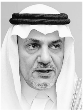
الامير تركي الفيصل

آدم فلانة (الاستماع) المملكة مضاف الدول المتقدمة . واستبعد سموه ان تحدث اية تغيرات في سياسة المملكة بعد رحيل الملك فهد بن عبدالعزيز وقال: لا توقع اي تغير وستكون هناك استمرارية في السياسات الحكيمة التي اتخذها الملك رحمه الله . واوضح سموه ان سفارة المملكة ستفتح ابوابها منذ العاشرة صباح اليوم لتلقي العزاء .