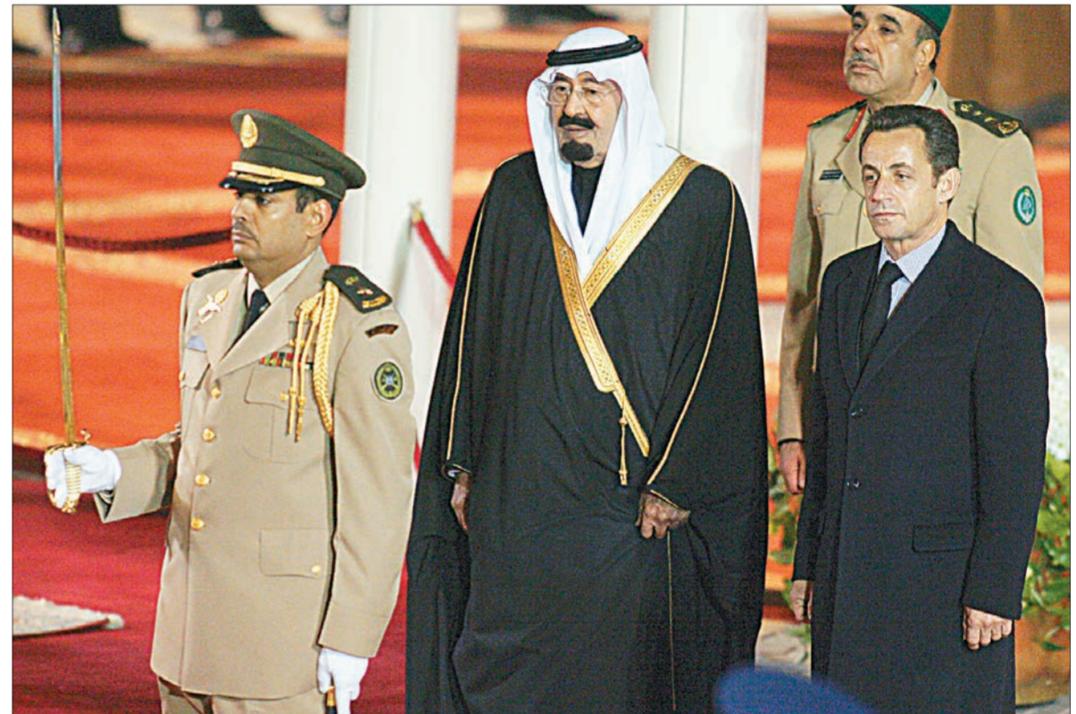
خادم الحرمين الشريفين لدى استقباله الرئيس الفرنسي في مطار الملك خالد الدولي أمس

بن سلمان بن محمد آل سعود مستشار خادم الحرمين الشريفين وصاحب السمو الملكي الأمير فيصل بن عبدالله بن عبدالعزيز رئيس جمعية الهلال الأحمر السعودي وأصحاب المعالي الوزراء وكبار المسؤولين من مدنيين ومسيحيين وأعضاء السفارة الفرنسية لدى المملكة. كما صافح خادم الحرمين الشريفين الملك عبدالله بن عبد العزيز آل سعود أعضاء الوفد الرسمي المرافق لفخامة الرئيس نيكولا ساركوزي.