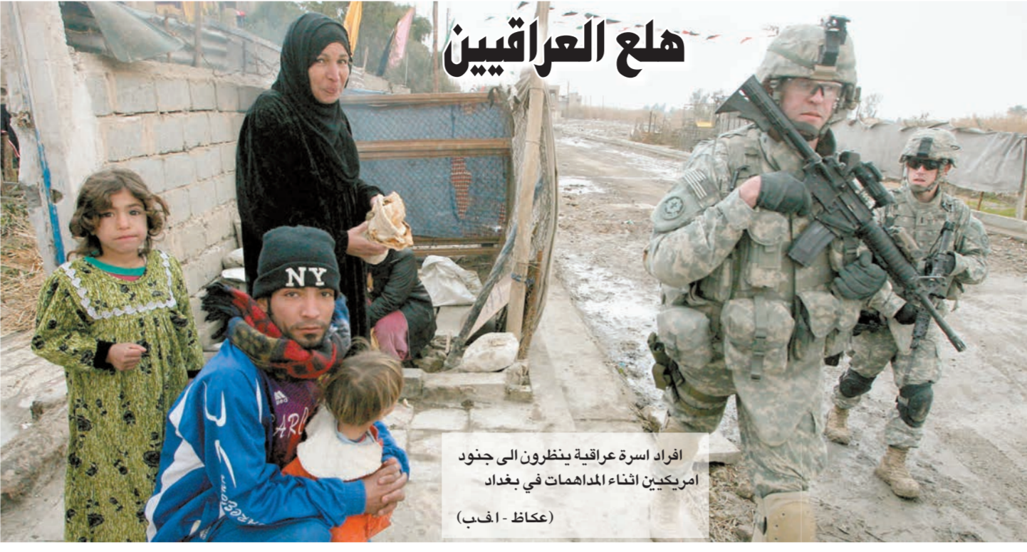
أفراد أسرة عراقية ينظرون إلى جنود أمريكيين أثناء المدامات في بغداد