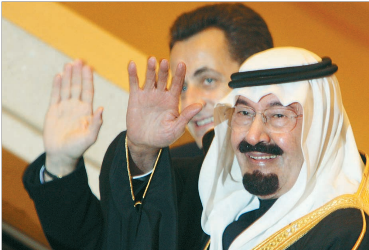
الملك وساركوزي يحييان مستقبلي الرئيس الفرنسي أمس