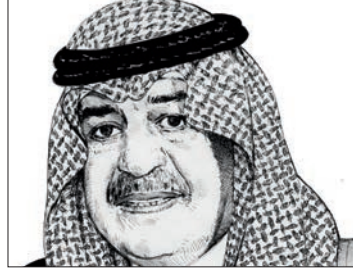
الأمير مقرن بربشة الفنان محمد الرئيس