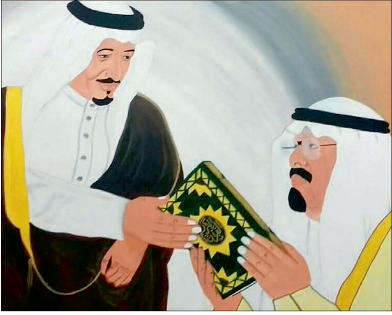
لوحة للفنان سامي الجفري.

وملاسته لهما مشقة، وأضاف الرئيس أن الخير والبركة في إخوانه والعائلة المالكة فإننا نتابع خادم الحرمين الشريفين الملك سلمان بن عبدالعزيز حفظه الله وولي عهد الأمين الأمير مقرن وولي العهد الأمير محمد بن نايف على السمع والطاعة. فيما قال الفنان سامي الجفري «إن خادم الحرمين الشريفين الملك عبدالله بن عبدالعزيز رحمه الله كان ذا بصمات إنجازية في كافة مناحي الحياة وأنه كان صاحب دور بارز في حل العديد من القضايا العربية والإسلامية رحمه الله وأسكنه فسيح جناته» وأضاف «نتابع الملك سلمان بن عبدالعزيز وولي عهده الأمين وولي العهد على السمع والطاعة وكلنا فداء للوطن».