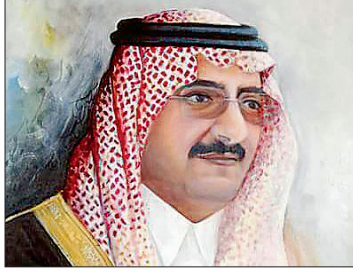
الأمير محمد بن نايف بربشة الفنان عبده الفايز

والأمراء أكد بقوله «إننا فقدنا قائداً حكيماً صادق الوعد والعهد وإننا لفرقة لحزنون ونسال الله العلي القدير أن يتغمده بواسع رحمته»، وأضاف أن عزاءنا هو مبايعة خادم الحرمين الشريفين الملك سلمان بن عبدالعزيز (حفظه الله) والذي يعد من رجالات الدولة والرجل السياسي القريب من المواطن وولي عهده الأمين صاحب السمو الملكي الأمير مقرن بن عبدالعزيز نائب رئيس مجلس الوزراء، وولي العهد صاحب السمو الملكي الأمير محمد بن نايف بن عبدالعزيز، فيما أبدى الفنان محمد الرئيس بالغ حزنه بوفاة الراحل الملك عبدالله، وقال «يقف العالم أجمع حزناً على فراق عبدالله، عبدالله الذي حوى الشعب بقلبه الكبير