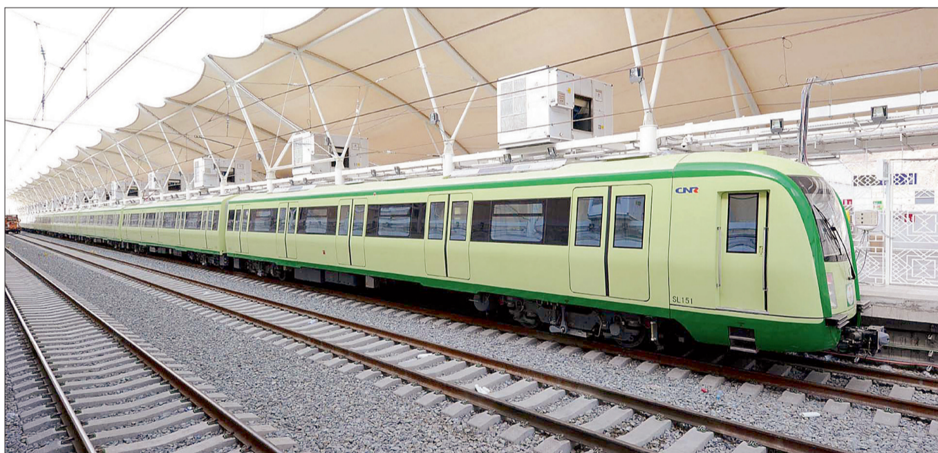
قطار المشاعر المقدسة كما بدأ أمس.

وجه صاحب السمو الملكي الأمير أحمد بن عبدالعزيز وزير الداخلية رئيس لجنة الحج العليا بتنفيذ مشروع قطار المشاعر المقدسة «الخط الشمالي» ليكون رديفاً لقطار المشاعر القائم (الخط الجنوبي) والذي يسهم في نقل نحو ٤٥٠ ألف حاج خلال رحلة الحج في المشاعر المقدسة.