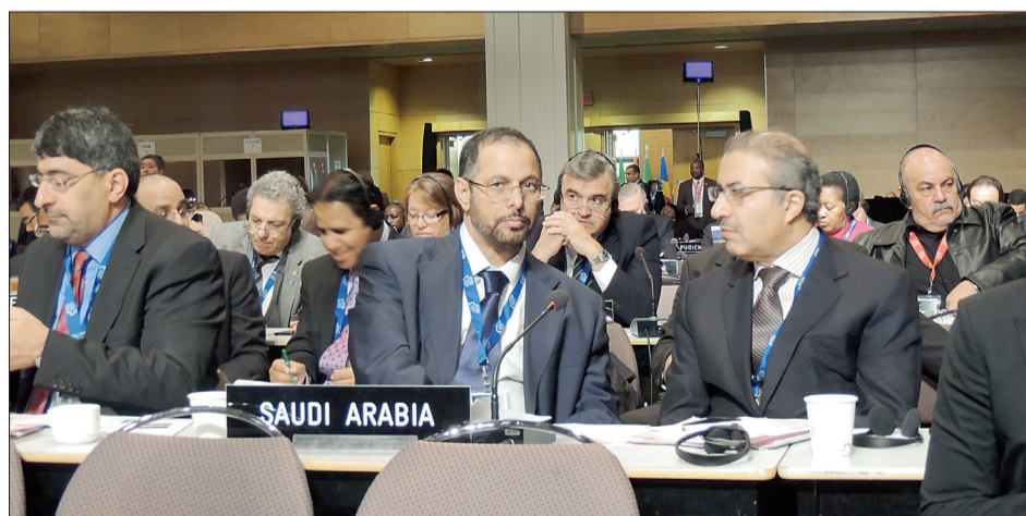
وفد الشورى يشارك في عمومية الاتحاد البرلماني الدولي.

وعبر عن تطلعه إلى آفاق جديدة في العلاقات والتعاون البناء بين مجلس الشورى ومجلس الشيوخ الكندي بما يخدم المصالح المشتركة للبلدين الصديقين. وكانت الدورة السابعة والعشرين بعد المائة للجمعية