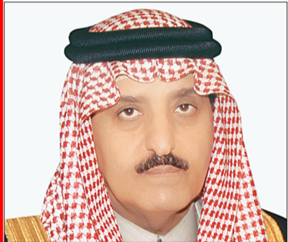
الأمير أحمد بن عبدالعزيز

التي تولونها وولي عهدكم، حفظكم الله، لكافة مرافق خدمات الحجاج والتي من شأنها تهيئة سبل الراحة لضيوف الرحمن وتمكينهم من أداء الفريضة بسهولة وأمان». وأوضح سموه أن عدد الحجاج القادمين لهذا العام قد نقص عن العام الماضي بـ ٧٧٩٦٨ حاجاً بنسبة قدرها ٤ ٪ تقريبا، وقال إن دخول حجاج هذا العام كان على النحو التالي: عن طريق الجو ١٦٢١٩٨٢ حاجاً، عن طريق البر ١١٢٠٢٠ حاجاً، عن طريق البحر ١٧٩٣٠ حاجاً، وهم يمثلون ١٨٩ جنسية من مختلف أقطار العالم. ودعا سمو الأمير أحمد بن عبدالعزيز الله العلي القدير أن يحفظ خادم الحرمين الشريفين لهذه الأمة قائداً وبانياً لنهضتها وأن يحفظ ولي عهده الأمين ويدعم على هذه البلاد نعمة الأمان والإيمان.