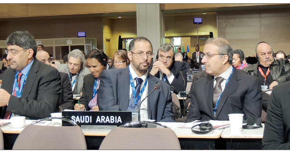
وفد الشورى يشارك في عمومية الاتحاد البرلماني الدولي.

وعبر عن تطلعه إلى أفاق جديدة من العلاقات والتعاون البنا بين مجلس الشورى ومجلس الشيوخ الكندي بما يخدم المصالح المشتركة للبلدين الصديقين. وكانت الدورة السابعة والعشرين بعد المائة للجمعية