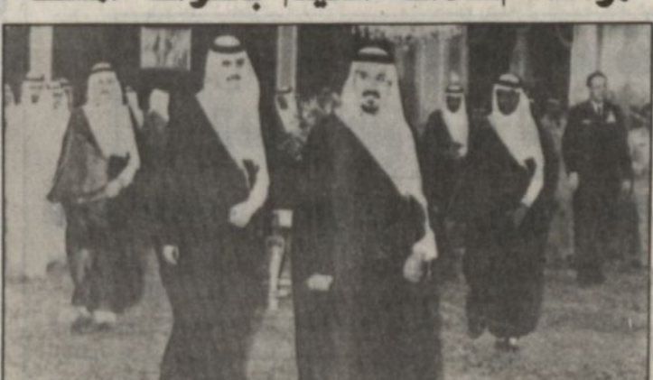
سمو الامير سلطان يقبع حفل عشاء بقشيرية الظهران، تيوك - عودة العظوي، واس:

وصل صاحب سمو الملكي الامير سلطان بن عبد العزيز النائب الثاني لرئيس مجلس الوزراء وزير الدفاع والطيران والمفتش العام الى الظهران امس في بداية جولة بالمنطقة الشرقية ضمن جولات سموه التفتيشية للقنوت العسكرية ومشاركته لافراد القوات المسلحة في مختلف المناطق بمناسبة عيد الفطر المبارك. وقد كان في استقبال سموه بالمنطقة الامراء وقائد المنطقة الشمالية الغربية اللواء الركن عبد العزيز آل الشيخ وقائد قاعدة الملك فيصل الجوية المقدم طيار ركن ناصر بن فراج القحطاني وصاحب سمو الملكي العقيد ركن طيار تركي بن ناصر بن عبد العزيز قائد قاعدة الملك عبد العزيز الجوية بالشرقية وكبار المسؤولين من مدنيين وعسكريين. (النتمة صفحة ١٣)