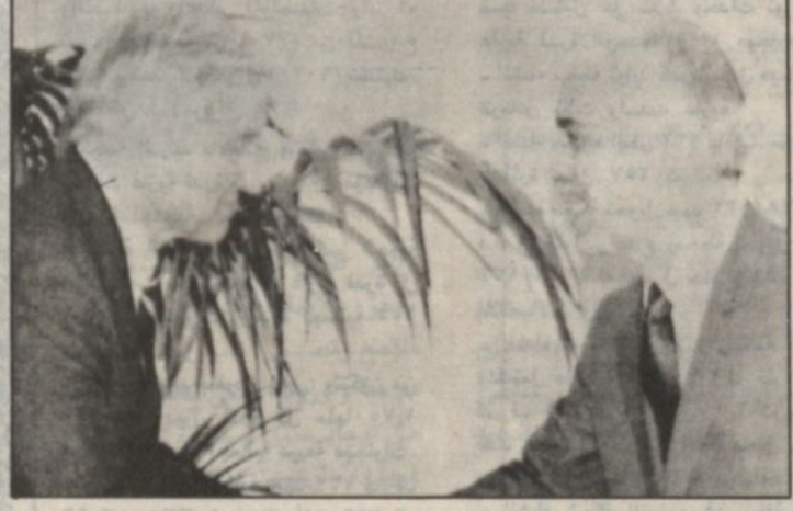
الملك حسين يصافح السناتور السابق من ولاية ايلينوي تشارلز بيبسي اثناء اجتماعه في واشنطن امس.