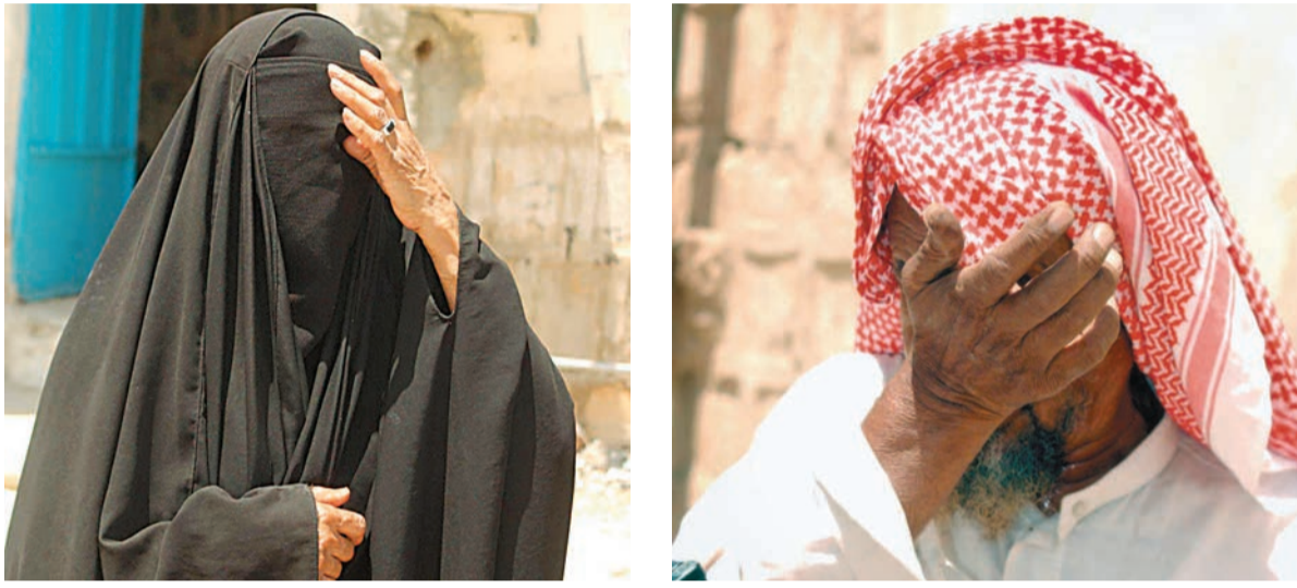
مسنان في حي الشميسي بالرياض يخفيان دموع الفرح لحظة علمهما بزيادة مخصصاتهما ص ٤-١١