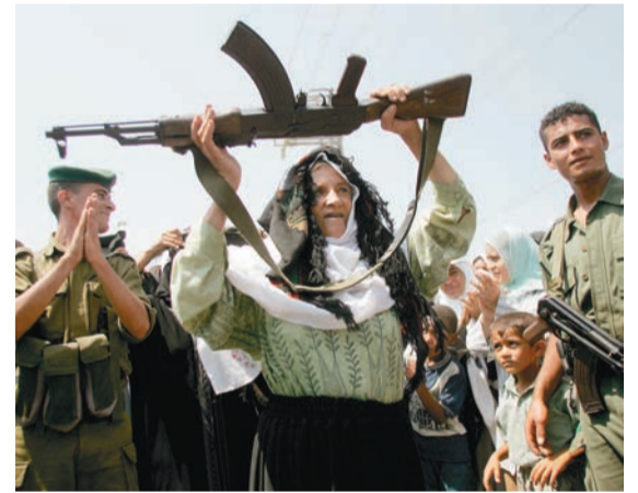
فلسطينية تحمل بنديقة خلال الاحتفال بالانسحاب من غزة

كشفت مصادر مطلعة أن غالبية المستوطنين الذين تم ترحيلهم من غزة قرروا التوجه لإقامة في مستوطنات الضفة الغربية في وقت تعهد رئيس الوزراء الإسرائيلي ارييل شارون لصحيفة «هيرالد تريبيون» بتعزيز السيطرة على الضفة وتوسيع المستوطنات فيها الأمر الذي اعتبره وزير الدولة الفلسطيني لشؤون الاستيطان والجدار أحمد مجدلاوي في تصريح له «عكاظ» أنه خطوة بالغة الخطورة مؤكداً أن السلطة ستبلغ اللجنة الرباعية وواشنطن بالأمر لأن تل أبيب لم تلتزم بما تعهدت به. (التفاصيل ص ٣٣)