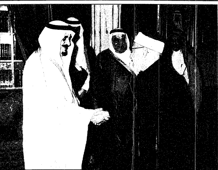
خادم الحرمين الشريفين يستقبل اعضاء المؤتمر الاسلامي لحقوق الانسان في البوسنة والهرسك