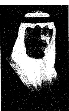
سمو ولي العهد

واس (الرياض): استقبل صاحب السمو الملكي الامير عبدالله بن عبدالعزيز وفي العهد ونائب رئيس مجلس الوزراء ورئيس الحرس الوطني بعد ظهر امس رئيس واعضاء مجلس ادارة الاتحاد العربي السعودي لكرة القدم واعضاء الجهازين الاداري والفني ولاعبة منتخب المملكة للشباب لكرة القدم تحت ١٩ سنة بمناسبة حصولهم على كأس اسيا الفضية والعشرين لكرة القدم والتي اقيمت مؤخرا بدولة الامارات العربية المتحدة وتأهلهم لنهائيات كأس العالم للشباب لكرة القدم عن قارة اسيا.